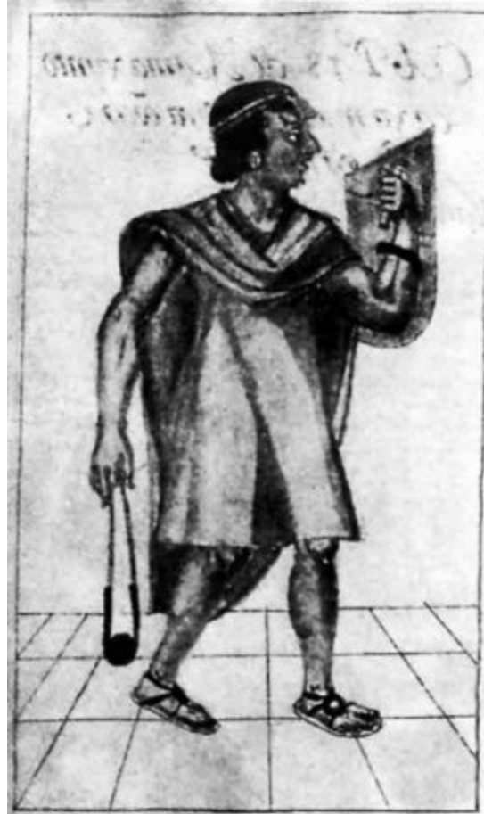
Un jefe inca.

Su organización social descansaba en el riguroso cumplimiento de las obligaciones para con la comunidad. El Estado, encabezado por un monarca absoluto llamado inca , estaba muy desarrollado. Sus ciudades, sus casas y sus templos revelaban un alto grado de civilización. Los bienes materiales, los utensilios y la vestimenta eran de gran calidad.