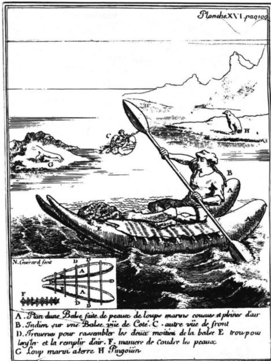
Chango en balsa de cueros de lobo según Frezier, viajero del siglo XVIII.

En las islas situadas al sur de Chiloé habitaban los chonos , que también vivían principalmente de los alimentos del mar. Con sus frágiles embarcaciones recorrían los puntos costeros de las islas.