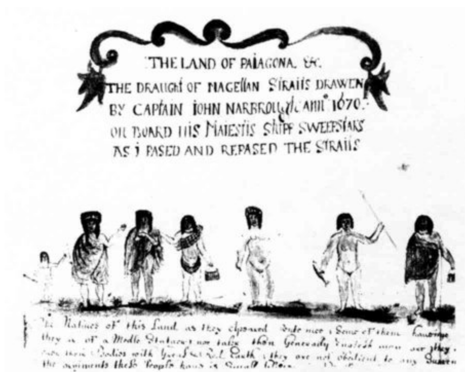
Indios fueguinos dibujados por un explorador inglés de 1670.

Los onas habitaban la isla de Tierra del Fuego y generalmente no se aventuraban en el mar. Los yaganes y los alacalufes navegaban continuamente en pequeñas piraguas por los canales magallánicos.