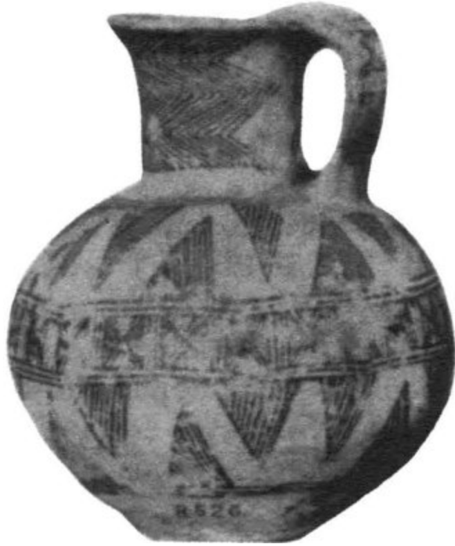
Cerámica araucana del tipo "Valdivia".

Usaban utensilios de greda y madera de confección muy rústica. En cambio sus tejidos de lana de llama y de guanaco, tales como ponchos y frazadas, eran de hermosos dibujos y colores.