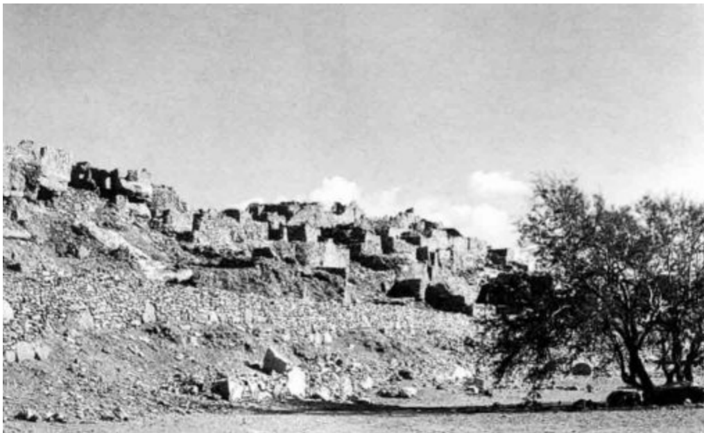
El pucara de Lasana, aldea fortificada de los atacameños.

Cada agrupación tenía una especie de dios, el Pillán , que era la representación de los antepasados. Había también un Pillán superior, que era un dios del bien y del mal.