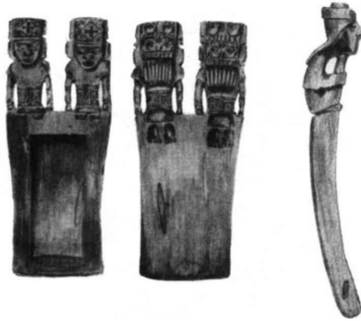
Tableta de los atacameños por ambos lados y de perfil.