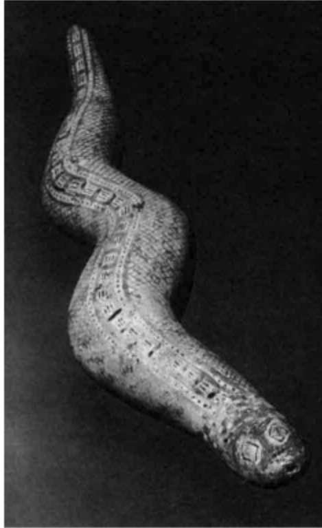
Pieza de cerámica única en su tipo. Diaguita con influencia inca.

Pequeñas agrupaciones reconocían la autoridad de los caciques y en conjunto formaban levos , cuyas familias tenían un antepasado común.