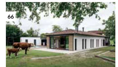
66 Casa en Güemes