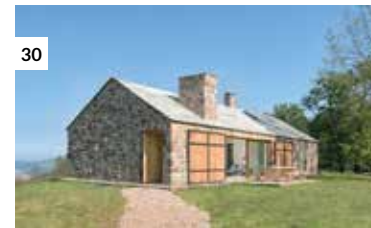
30 Villa Slow