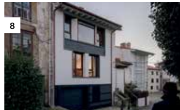
8 Casa en Comillas

Impreso en Argentina / Printed in Argentina Octubre 2021 / October 2021