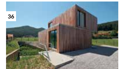
36 Casa More