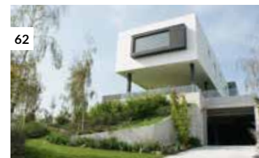
62 Casa Pontigar