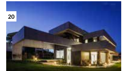
20 Casa Hanami