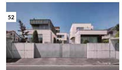
52 Casa en Santander