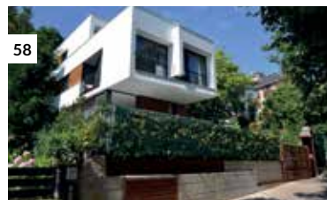
58 Casa Menéndez Pelayo 103