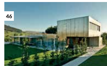
46 Casa Estudio-Taller en Mijares