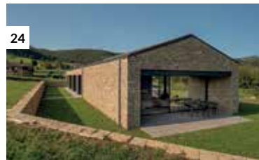
24 Casa en Bareyo