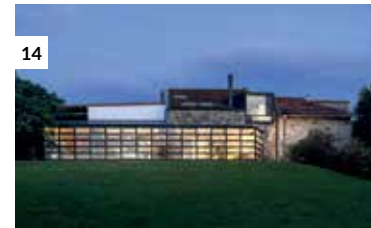
14 Casa Estudio en Las Presillas