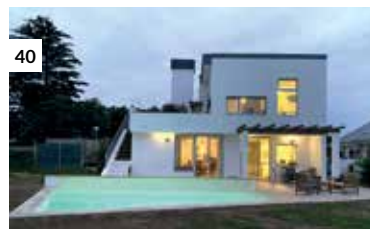
40 Casa Lobo/García