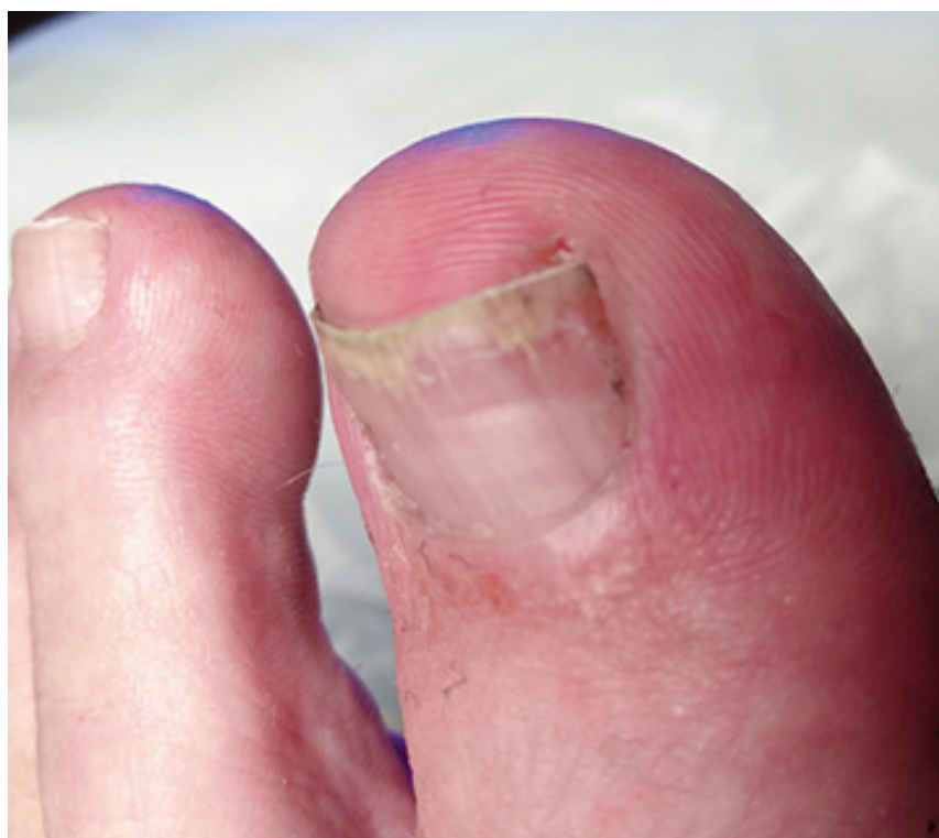
Abb. 1.4 Ohne Licht mit Verdacht auf Mykose

Mit dieser Dokumentation kann im Bedarfsfall eine optimale Therapieabsprache interdisziplinär in Zusammenarbeit mit Ärzten und anderen Berufsgruppen erfolgen.