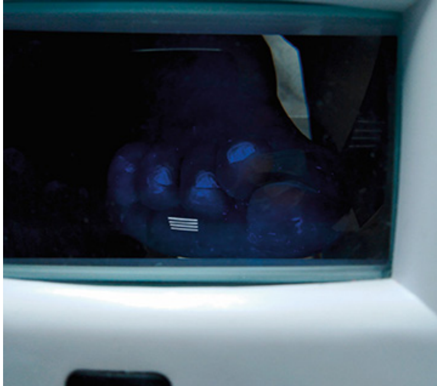
Abb. 1.9 Beurteilung der Nägel mittels Wood-Lampe Abb 1.7 bis 1.9: © Margarita Zdor