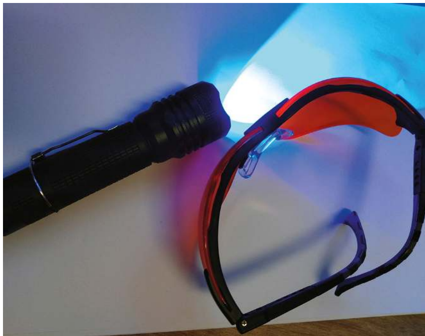
Abb. 1.10 Diagnostik mit der LED-Lampe von Onyfix oder Blue Light und orangener Schutzbrille