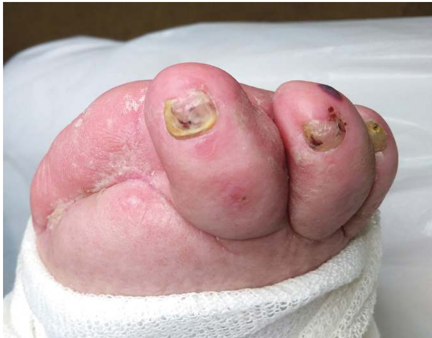
Abb. 1.11 bis 1.14 Erhärtung des Verdachts auf Mykose

Dieses Buch soll eine Hilfestellung bei der Diagnostik und Therapie für die Praxis sowie im Bereich der Prophylaxe ein wichtiger Beitrag zur Fußgesundheit sein, denn viele