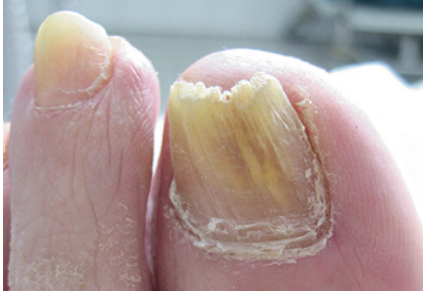
Abb. 1.1 Ein Nagel, mehrere Nagelerkrankungen: Verdacht auf Onychomykose, Onychiauxis, Onychorrhexis, beginnendes Pterygium

Die Kamera ist ein kompatibles System für alle Praxen mit EDV und hat eine intuitiv gestaltete Benutzeroberfläche für gestochen scharfe Bilder. Eine automatische Zuordnung zum Patienten sowie die multimediale Versendung der Bilder sind möglich. Die Kamera liefert eine zentrale Schnittstelle zur Bilddokumentation und interdisziplinären Kommunikation direkt an den Arbeitsplatz des Podologen. Die PodoCam verfügt über eine schmale Optik mit eigener LED-Lichtquelle, die auch für schwer zugängliche Stellen geeignet ist. Die Bilder sind automatisch immer scharf. In der Wundtherapie können Sie aus 1 cm Entfernung an den Wundrand blicken oder in den Nagelfalz hineinsehen. Die PodoCam ist hygienisch aufbereitbar. Dank USB ist sie an jedem Arbeitsplatz mit PC/Laptop einsetzbar. Sie ermöglicht eine bis zu 200-fache Vergrößerung via iPad, Bildschirm oder Smartphone. Die virtuelle Bildübertragung führt über ein intensives Wahrnehmungserlebnis, beispielsweise trotz Neuropathie, zu einer neuen Compliancefähigkeit des Patienten. Dank dieses