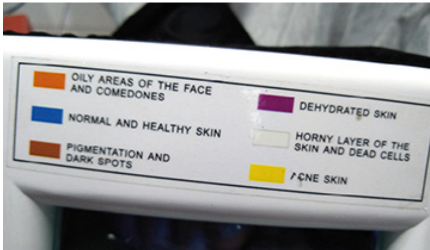
Abb. 1.8 Farben der Wood-Lampe