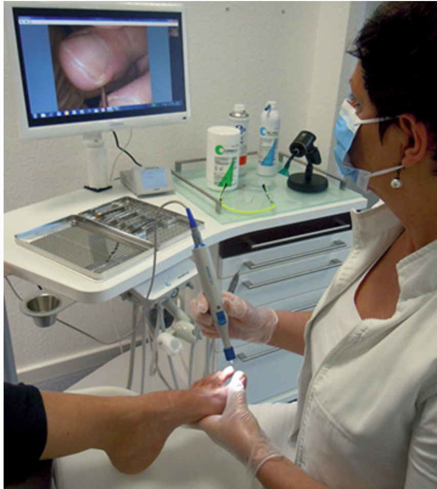
Abb. 1.3 Die PodoCam im Praxiseinsatz