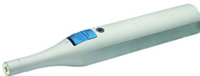
Abb. 1.2 Die PodoCam

In einem arbeitsreichen Podologenalltag ist die PodoCam ein revolutionäres Multifunktionsstool für präzise Diagnostik, Dokumentation und Kommunikation, auf das ein Profi nicht mehr verzichten sollte.