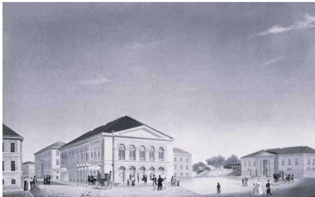
Nationaltheater in Christiania um 1837

Engebretsen Moe Sagen und Märchen, um einen Beweis für die reiche literarische Tradition Norwegens vorlegen zu können. Norwegen befindet sich in der fatalen Situation, zwar eine eigene Nation zu gründen, aber keine eigene Schriftsprache vorweisen zu können. In den 40er Jahren des 19. Jahrhunderts sammelt deshalb Ivar Aasen einfach Dialektmaterial, aus dem er das Landsmål, das Nynorsk, in Abgrenzung zu der bisher dänisch dominierten Schriftsprache, dem Riksmål, schafft. Der Violinist Ole Bull versteht es nicht nur, hervorragend Geige zu spielen, sondern auch, das Interesse für das norwegische Musikkulturgut zu wecken. Als Hauptvertreter des „Goldenen Zeitalters“ der norwegischen Musik gilt unangefochten Edvard Grieg. Parallel dazu erfolgt das Streben nach einem selbstständigen norwegischen Theater, das sich endlich von dem dominanten dänischen Einfluss lösen soll. Was bleibt Ole Bull also anderes übrig, als 1849 das „Norske Teatret“, das norwegische Nationaltheater, in Bergen zu gründen. Mit Bjørnstjerne Bjørnson und Henrik Ibsen hat dieses junge norwegische Theater auch gleich zwei besonders aktive und attraktive Wegbereiter zur Hand.