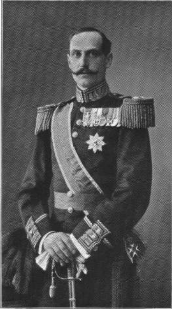
König Håkon VII. von Norwegen

Diese Autonomiebestrebungen werden von einem neuen nationalromantischen Selbstwertgefühl getragen: Im 19. Jahrhundert erlebt Norwegen die größte kulturelle Blütezeit seiner Geschichte. Zwischen 1850 und 1900 entwickelt sich als beherrschende kulturelle Strömung in intellektuellen Kreisen der Universität Christiania die so genannte Nationalromantik. In ihr äußert sich das Bedürfnis, eine eigene nationale Identität zu erlangen in den Bereichen Musik, Kunst und Literatur. Nach den Wurzeln muss man nicht lange suchen, man findet sie in der reichen kulturellen Vergangenheit, in der Geschichte des Landvolks, das die nationalen Werte besonders verkörpert und tradiert.