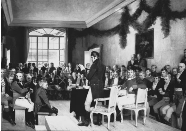
Verfassungsgebende Versammlung in Eidsvoll, Gemälde 1814

Da der dänische König so unklug ist, sich in den Napoleonischen Kriegen auf Napoleons Seite zu stellen, muss er nach dem Fall Napoleons im Kieler Frieden von 1814 zur Strafe Norwegen an Schweden abtreten. Die Norweger akzeptieren diese Personalunion mit den wenig geliebten Nachbarn zunächst nicht, erklären stattdessen in Eidsvoll sogleich ihre Unabhängigkeit und schaffen sich am 17. Mai 1814, dem heutigen Nationalfeiertag, kurzerhand eine eigene und dazu noch liberale Verfassung. Nach einem kurzen Krieg kann der Verlierer Norwegen wenigstens einen Kompromiss aushandeln: Die Personalunion mit Schweden bleibt zwar gesetzt, Norwegen darf aber seine Verfassung behalten. Über all dieses Ungemach hinaus erlebt Norwegen nach 1814 auch noch seine bisher schlimmste wirtschaftliche Krise. Der bis dahin florierende gemeinsame Markt mit Dänemark ist unwiderruflich aufgelöst. Bergwerke und Sägewerke verlieren ihre zahlungskräftigen ausländischen Abnehmer. Zahlreiche wohlhabende Bürger der Mittelklasse im Südosten Norwegens gehen Bankrott. Es kommt zu einer tiefgehenden und langanhaltenden Depression.