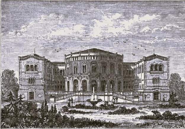
Storting-Gebäude in Christiania, Holzstich von