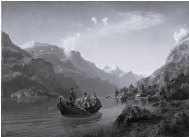
Brautfahrt auf dem Hardangerfjord, 1848

Da der dänische König so unklug ist, sich in den Napoleonischen Kriegen auf Napoleons Seite zu stellen, muss er nach dem Fall Napoleons im Kieler Frieden von 1814 zur Strafe Norwegen an Schweden abtreten. Die Norweger akzeptieren diese Personalunion mit den wenig geliebten Nachbarn zunächst nicht, erklären stattdessen in Eidsvoll sogleich ihre Unabhängigkeit und schaffen sich am 17. Mai 1814, dem heutigen Nationalfeiertag, kurzerhand eine eigene und dazu noch liberale Verfassung. Nach einem kurzen Krieg kann der Verlierer Norwegen wenigstens einen Kompromiss aushandeln: Die Personalunion mit Schweden bleibt zwar gesetzt, Norwegen darf aber seine Verfassung behalten. Über all dieses Ungemach hinaus erlebt Norwegen nach 1814 auch noch seine bisher schlimmste wirtschaftliche Krise. Der bis dahin florierende gemeinsame Markt mit Dänemark ist unwiderruflich aufgelöst. Bergwerke und Sägewerke verlieren ihre zahlungskräftigen ausländischen Abnehmer. Zahlreiche wohlhabende Bürger der Mittelklasse im Südosten Norwegens gehen Bankrott. Es kommt zu einer tiefgehenden und langanhaltenden Depression.