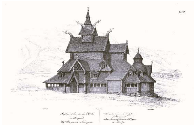
Stabkirche in Borgund

Diese Autonomiebestrebungen werden von einem neuen nationalromantischen Selbstwertgefühl getragen: Im 19. Jahrhundert erlebt Norwegen die größte kulturelle Blütezeit seiner Geschichte. Zwischen 1850 und 1900 entwickelt sich als beherrschende kulturelle Strömung in intellektuellen Kreisen der Universität Christiania die so genannte Nationalromantik. In ihr äußert sich das Bedürfnis, eine eigene nationale Identität zu erlangen in den Bereichen Musik, Kunst und Literatur. Nach den Wurzeln muss man nicht lange suchen, man findet sie in der reichen kulturellen Vergangenheit, in der Geschichte des Landvolks, das die nationalen Werte besonders verkörpert und tradiert.