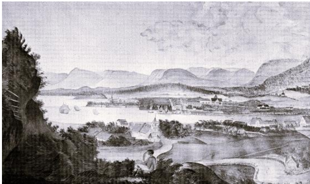
Magrethe Kristine Tholstrup: Christiania 1814

Entwicklung anzuschließen. Die erste Eisenbahnlinie des Landes von Christiania (Oslo) nach Eidsvoll wird 1854 freigegeben, und es werden Telegrafleitungen verlegt. In der Landwirtschaft werden neue Bewirtschaftungsmethoden eingeführt. Die Grundlage für die moderne Industrie Norwegens wird in den 1840er Jahren gelegt, indem die ersten Textilfabriken und Maschinenwerkstätten gegründet werden. Ein Schwerpunkt der Wirtschaft liegt aber weiterhin auf dem Fischfang bzw. auf der Fischfangindustrie. Zwischen 1850 und 1880 nimmt die norwegische Handelsflotte beträchtlich an Umfang zu. Die industrielle Revolution bringt für die einen Wohlstand, aber auch Armut für andere und neue Klassengegensätze. Die Antwort darauf ist die Entstehung der norwegischen Arbeiterbewegung ab 1848. Aufgrund der Armut bricht wie in anderen Teilen Europas auch in Norwegen eine Riesenauswanderungswelle nach Nordamerika aus.