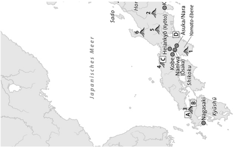
Karte 1: Geographischer Überblick (Peter Palm, Berlin).