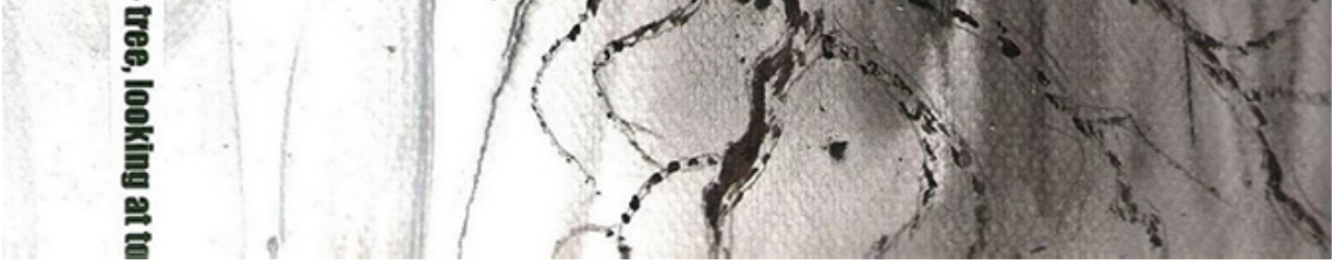
tree, looking at to