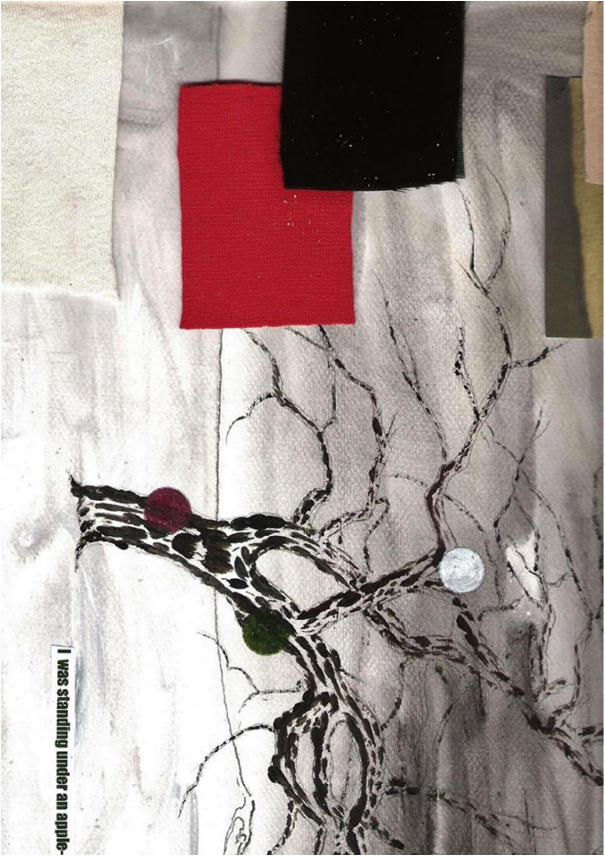
I was standing under an apple-