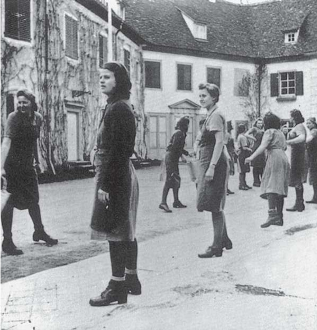
Sophie Scholl (2. v. li.) im Reichsarbeitsdienst, Krauchenwies, Frühjahr 1941

Manche der Frauen, die mit Sophie in Krauchenwies waren, haben vor allem gute Erinnerungen an den Reichsarbeitsdienst, einige bezeichnen diese Zeit sogar als die «unbeschwerteste» [7] ihres Lebens, vor allem diejenigen, die zuvor oder danach in Arbeitsverhältnissen oder familiären Zwängen steckten, die sie mehr einengten