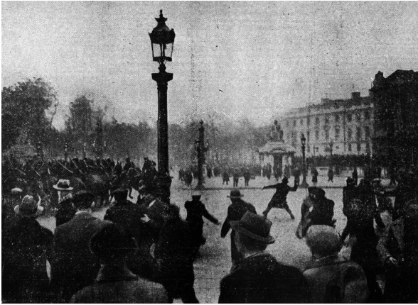
Abb. 1: Straßenschlacht vom Februar 1934

sich wie sein Vater in der sozialpolitisch aktiven Conférence Saint-Vincent-de-Paul . 1937 wurde er sogar ihr Vorsitzender. Er schrieb gelegentlich in der katholischen Revue Montalembert , der Hauszeitschrift des Wohnheims. Noch 1938 nahm er an der Wallfahrt nach Chartres sowie an der Fronleichnamsprozession teil. 12 Bis zum Abschluss seines Studiums hat er ein ruhiges, geordnetes Leben geführt.