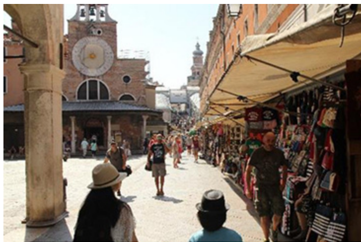
Abb. 1, San Giacomo mit der großen Uhr heute

jetzigen Rialto-Markt kam es zur Wahl des ersten Dogen 697. Zwischen dieser Wahl und der Abdankung des letzten Dogen 1797 liegen genau 1.100 Jahre. Kaum ein europäisches Zentrum hat sich über eine so lange Zeit dermaßen stabil gehalten.