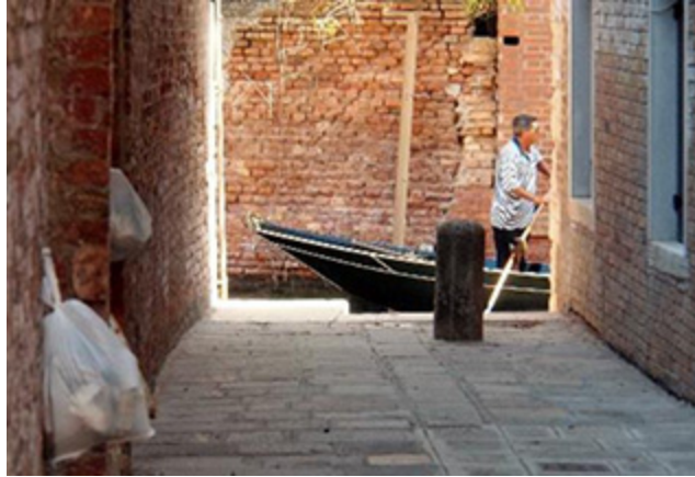
Abb. 2. Vorsicht: Hier endet ein Weg in einem Kanal