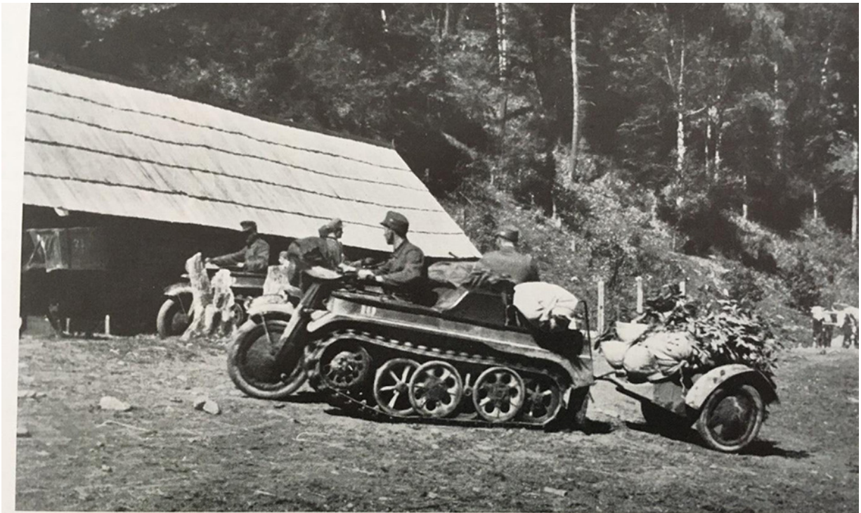
Endlos dehnen sich die Waldwege, schmale Pfade winden sich entlang reißender Gebirgsbäche. Hier bewähren sich die Kettenkräder unserer Nachschubeinheiten. Durch gerölldurchsetzte Furten und an steilen Hängen, bedroht von den Kugeln der in den Wäldern verborgenen Partisanen, folgen sie den vorausgestürzten Jägern.