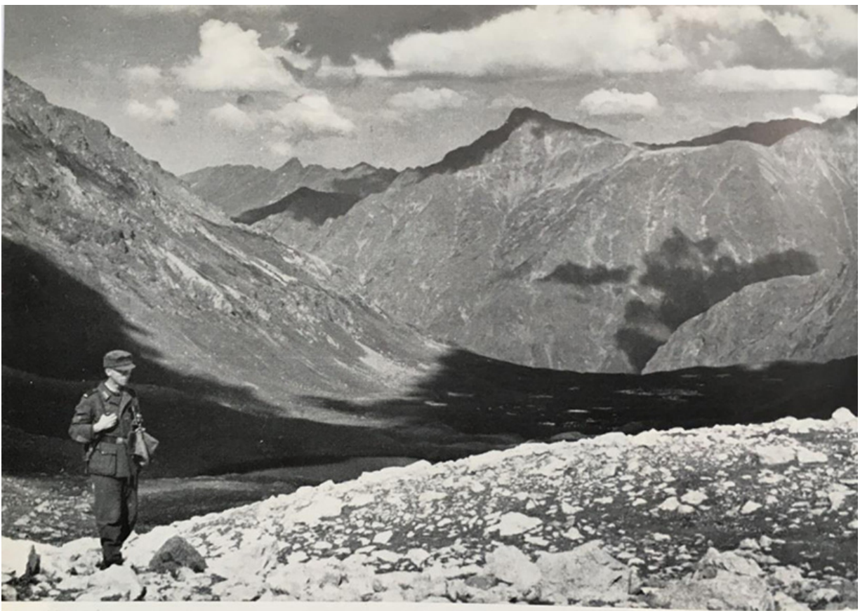
Im Winter 1942/43 habe ich bei meinen Besuchen in vordersten Stellungen auf Skiern diese Hänge befahren. Über felsdurchsetzte Hänge ansteigend, schauen wir kurz unter dem Santscharo-Paß zurück auf die nach Norden tief eingeschnittene Furche des großen Laba-Tales. Um diesen Felskopf am Allistrachou-Paß, von unseren Jägern Matterhorn genannt, wurde im Oktober 1942 in vielen nächtlichen Stoßtruppunternehmungen gerungen.

Im Winter 1942/43 habe ich bei meinen Besuchen in vordersten Stellungen auf Skiern diese Hänge befahren.