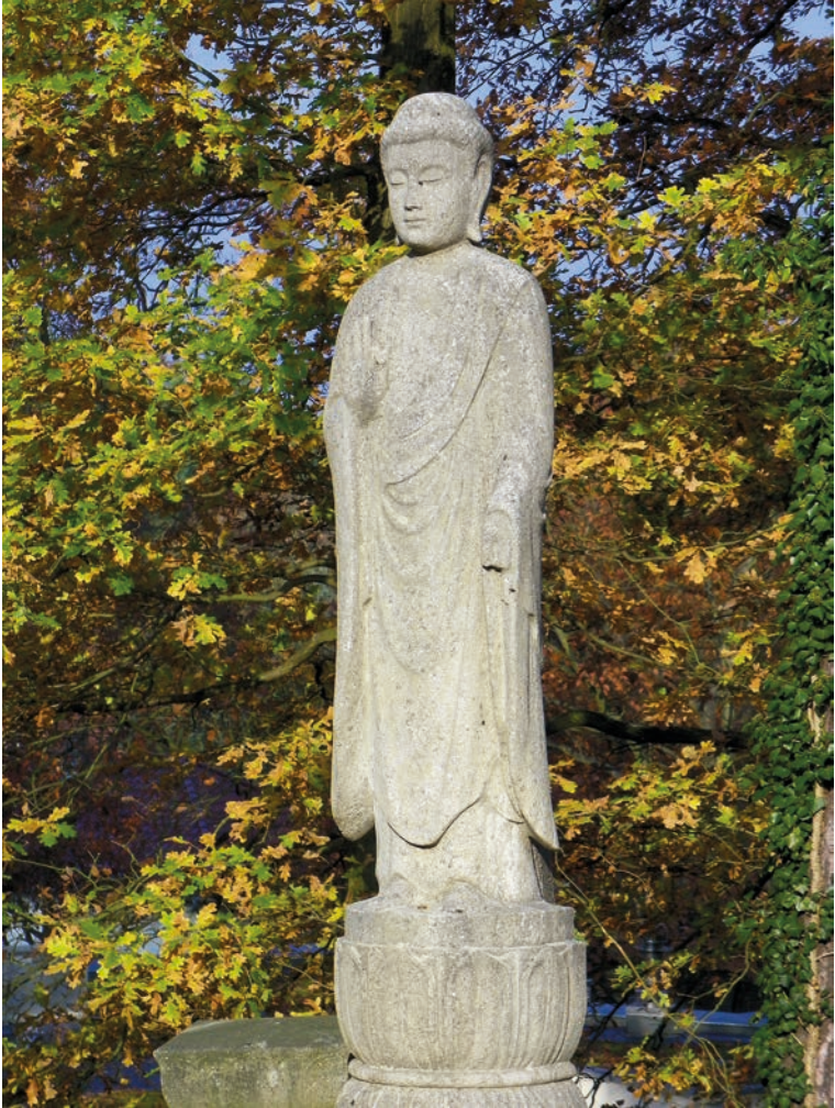
Abb. 1: Buddha-Statue auf der Stüpa-Terrasse hinter dem Tempel, 2010