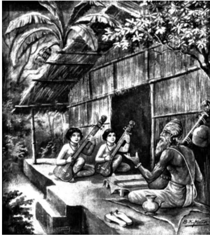
Un Maestro junto a dos de sus discípulos enseñando el sagrado arte de la música devocional