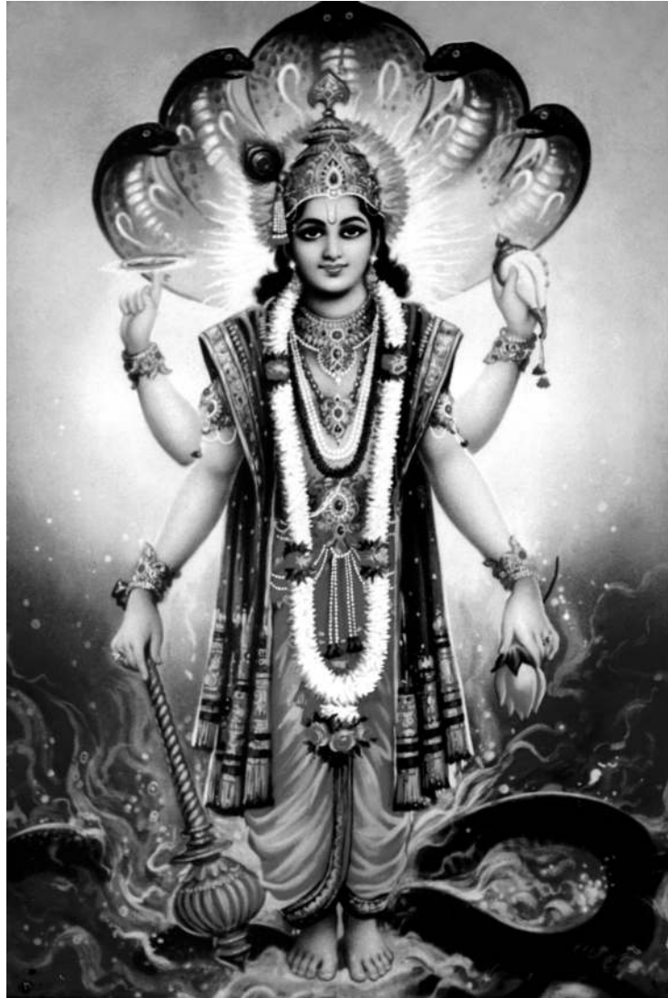
El Bendito Señor Vishnu-Narayana