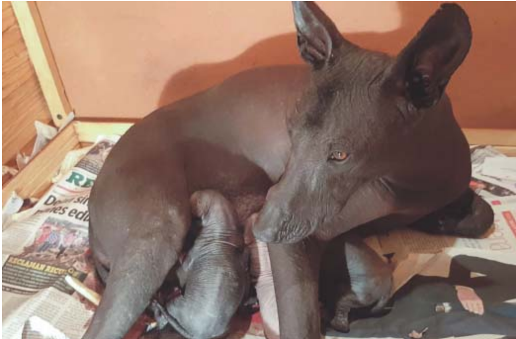
Fotografía 1. Hue Hue y sus cachorros 1 . Toluca, Estado de México. 2019.