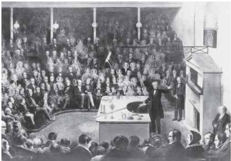
Abb. 1: Michael Faraday bei seiner Weihnachtsvorlesung am 27. Dezember 1855.

Ein Schüler Davys, Michael Faraday, ließ es sich nicht nehmen, alljährlich zur Weihnachtszeit Vorlesungen für Kinder und Jugendliche abzuhalten, die zu einer Art „Straßenfeger“ in London wurden, so etwa seine berühmte Vorlesungsreihe „Naturgeschichte einer Kerze“ (Faraday 1979).