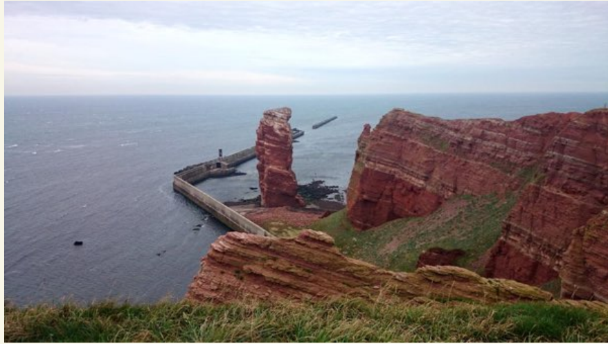
Der »Klassiker«: Blick vom Oberland auf die »Lange Anna«

Was sollen erst Segler in Irland, England oder Frankreich sagen? Dort trifft der Atlantik ungebremst nach Tausenden von Seemeilen auf die Küste. Dort gibt es Gezeitenunterschiede, die wesentlich höher als die der Nordsee sind. Der Tidenhub an der deutschen Nordseeküste liegt zwischen einem und vier Metern. Am Mont St. Michel an der französischen Atlantikküste beträgt dieser Tidenhub sagenhafte 12 bis 14 Meter. Und trotzdem wird dort, ebenso wie bei uns, gesegelt. Und ist der englische Kanal mit seinem dichten Schiffsverkehr und seiner Strömung nicht ein extra schwieriges Revier? Trotzdem wird auch dort gesegelt. Man sollte die Nordsee nicht unterschätzen: Sie hat tückische Stellen, etwa die Seegatte zwischen den ostfriesischen Inseln, über die man in die Häfen auf der Südseite gelangt. Dort ist höchste Vorsicht geboten. Aber es ist auch nicht nötig, die Nordsee zu meiden.