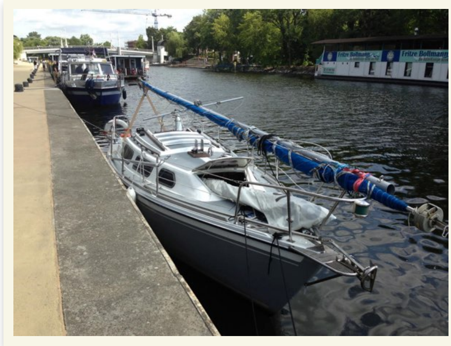
Die »Seestern« liegt am Kai in Brandenburg an der Havel, sicher vertäut, mit gelegtem Mast