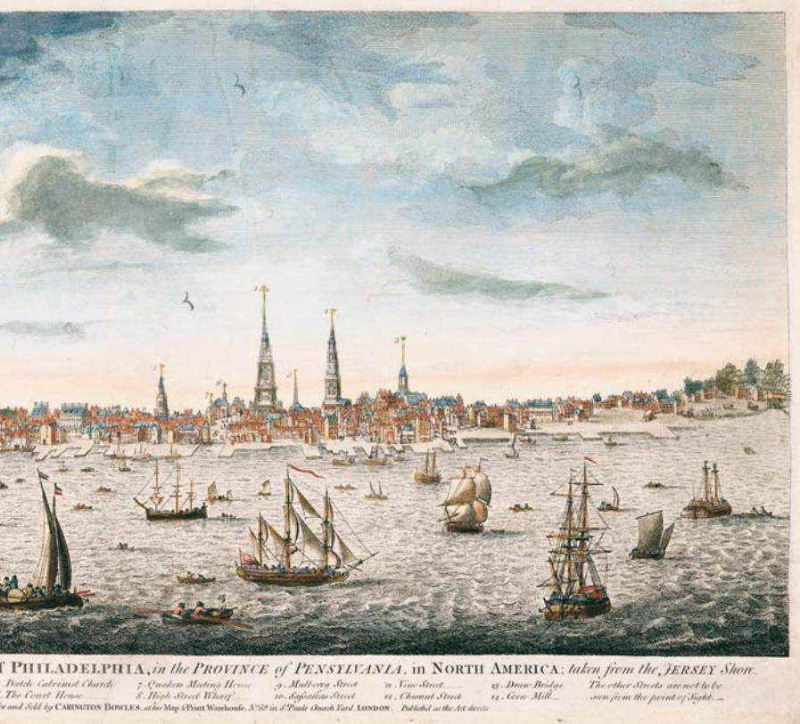
Philadelphia um 1770

Die Krise zwischen der Krone und den dreizehn amerikanischen Kolonien, die 1776 zur Unabhängigkeitserklärung und zum Unabhängigkeitskrieg führen sollte, brach im Frühling und Sommer 1766 zum ersten Mal unübersehbar auf. Franklins Besuch in Göttingen fiel in diese Zeit. 6 Darum muss, bevor von dieser Reise die Rede ist, zunächst ein Blick auf die politischen Auseinandersetzungen geworfen werden, in die sich Franklin in London verwickelt sah. Denn deren Auswirkungen reichten weit über Großbritannien hinaus, bis in die Universitätsstadt des Kurfürstentums Hannover.