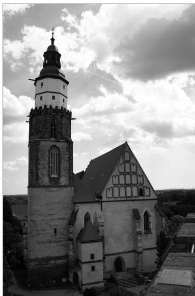
Abb. 11: St. Marien, Hauptkirche von Kamenz