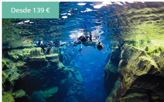
Snorkeling en Silfra