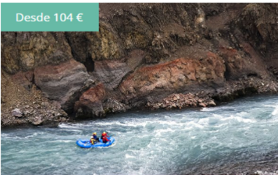
Rafting en Skagafjörður