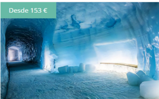
Adéntrate en el glaciár