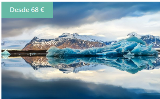
Zodiac en Jökulsárlón