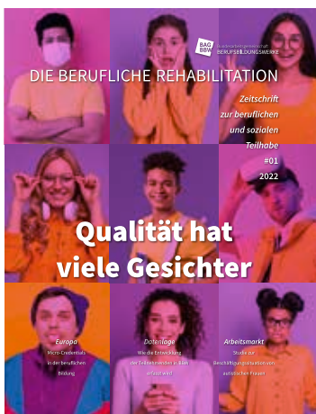
Qualität ist mehr als eine Kennzahl.