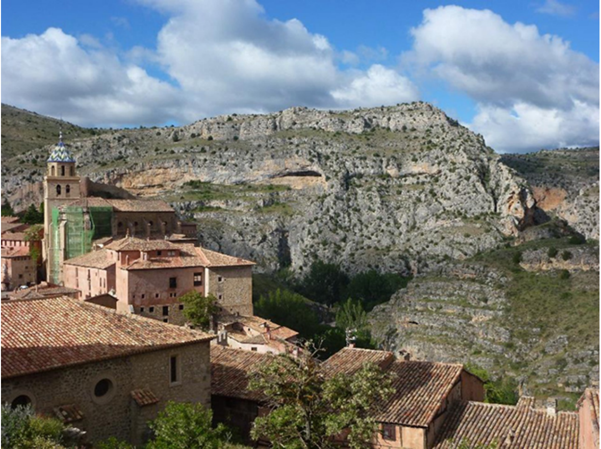
Her ser man en ´muela´ kindtand, lige udenfor byen

Man parkerer nedenfor byen og så er det ellers om at kridte skoene, for nu foregår al videre færdsel til fods. Biler kan overhovedet ikke køre i byen, hvis gader ofte ikke er mere end 1 m. brede. Trapper fører op til byen og så er det ellers bare om at slentre rundt og tage det hele ind. Vi ankom nok ved 9 tiden om morgenen og byen var dårligt nok vågnet. Der var mere eller mindre mennesketomt og ingen barer at se - uha - det tegnede ikke godt for vores voksende kaffetrang. Men man har vel stamina, så vi vandrede rundt i de smalle gader og op mod borgen og murene. Det hele var meget interessant og det er sjældent at se en så fuldstændig intakt middelalderby.