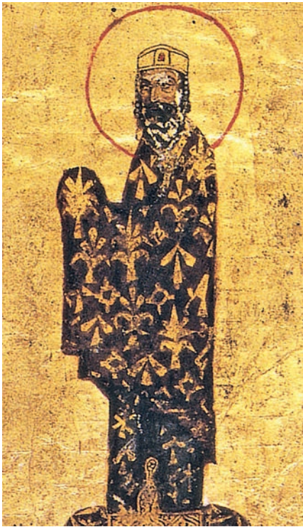
Der byzantinische Kaiser Alexios I. Komnenos, Istanbul, Hagia Sophia.

lenten Züge eines Heiligen Krieges an – »Deus vult!«, Gott will es!, sollen die Teilnehmer manchen Chronisten zufolge gerufen haben –, als die vereinte christianitas zur Überzeugung gelangte, dass sich der Sieg mit himmlischer Hilfe würde erringen lassen. Der Appell Urbans II. entspricht faktisch den Kriterien einer echten »Geschichtstheologie«: Unserer Sünden wegen – nostris peccatis exigentibus – habe Gott zugelassen, dass die Sarazenen die heiligen Stätten besetzten. Nun aber vergebe er seinem Volk, das so begierig auf Besserung sinne, und gewähre deshalb seine Hilfe bei der christlichen Rückeroberung, die vielerorts vorangetrieben werde, von der Iberischen Halbinsel bis nach Sizilien – und nun weiter bis in den Orient.