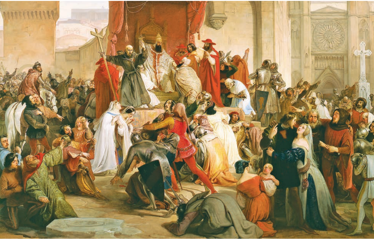
Francesco Hayez, Papst Urban II. ruft in Clermont zum ersten Kreuzzug auf , 1835, Mailand, Gallerie di Piazza Scala.

arabische Dominanz ablösen, nachdem sie das byzantinische Heer in der Schlacht in der Ebene von Manzikert 1071 geschlagen und keinen geringeren als den Basileus Romanos IV. Diogenes gefangen genommen hatten. Drei Jahre später verkündete Gregor VII. unmittelbar nach der Besteigung des päpstlichen Throns in wenigstens sechs Briefen sein Vorhaben, sich höchstpersönlich an die Spitze eines Feldzuges in den Orient zu setzen und bis nach Jerusalem vorzudringen. In die Tat umgesetzt wurde dieser Plan allerdings erst gegen Ende des Jahrhunderts und man fragt sich, weshalb. Nun, sagen wir, dass der Appell von Clermont nicht nur lang gehegte Erwartungen aufgriff, sondern auch die Vorstellungswelt eines Publikums ansprach, das überaus empfänglich für eine »starke« Idee wie jene war, manu militari zur Befreiung Jerusalems zu schreiten. In dieser Idee läuft manches zusammen: Seit geraumer Zeit dienten im byzantinischen Heer auch Söldner aus dem Westen, in der Regel Normannen, die in den 1080er-Jahren allerdings