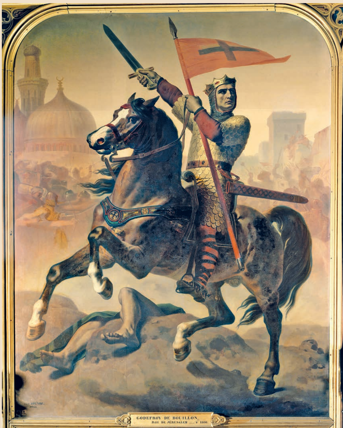
Émile Signol, Reiterbildnis Gottfrieds von Bouillon, König von Jerusalem , 1844, Versailles, Musée du Château.