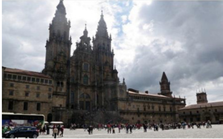
1: Santiagon katedraali - Plaza Obradoiro

Camino de Santiago on joukko vanhoja pyhiinvaellusreittejä manner-Espanjassa. Kuuluisin on Camino Francés joka usein lähdetään Ranskan puolelta, Sain Jean Pied de Port-nimisestä kylästä. Kuitenkin osa lähtee pidemmältä Ranskasta mm Le Puysta. Suomen Hattulassa on reittien pohjoisin alkupiste. Reiteillä on kuljettu keskiaikana runsaastikin. Myös pohjolasta lähdettiin Caminolle ja ne jotka sen koettelemukset kestivät olivat melko kunnioitettuja kansalaisia. Mm Ruotsin Pyhä Birgitta vaelsi miehensä kanssa. Ammoin olikin hieman enemmän haastetta vaeltaa jalkaisin Santiagoon jo käytännön ongelmien vuoksi.