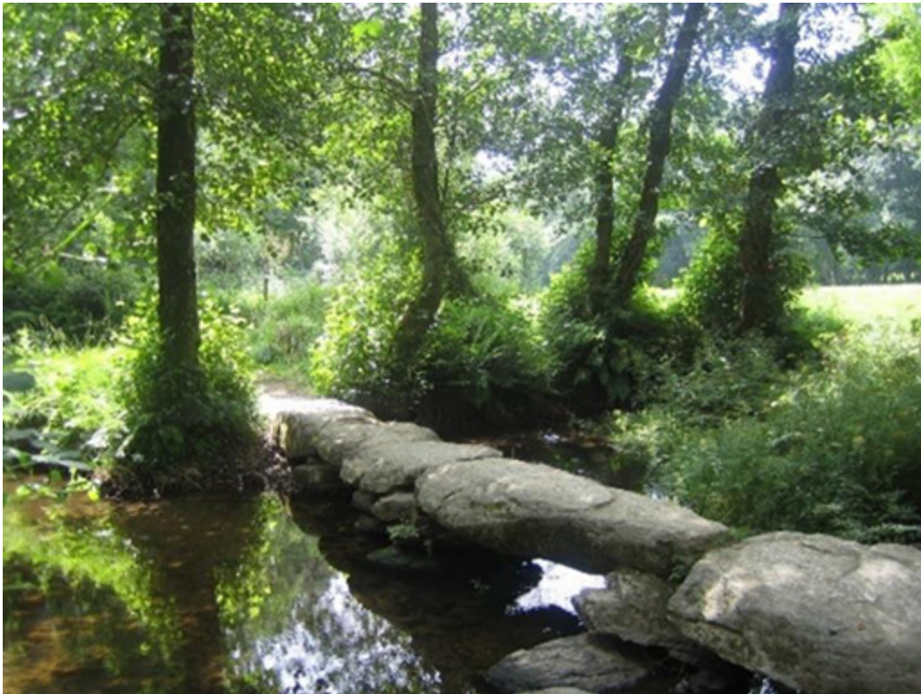
3 : Kivisilta Rio Catasolin yli

"Tous Les Matins du Monde" - Alain Corneau