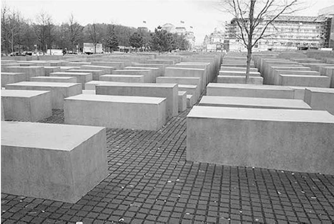
Abb. 1: Peter Eisenman (*1932): »Denkmal für die ermordeten Juden Europas«, Berlin, fertiggestellt 2005, im Hintergrund (Mitte) das Reichstagsgebäude sowie das Brandenburger Tor

organisierte Pfade hindurchführen. Zudem wurden 41 Bäume auf das wellenförmig angelegte 19.000 m 2 große Areal gepflanzt ( www.holocaust-mahnmal.de ).