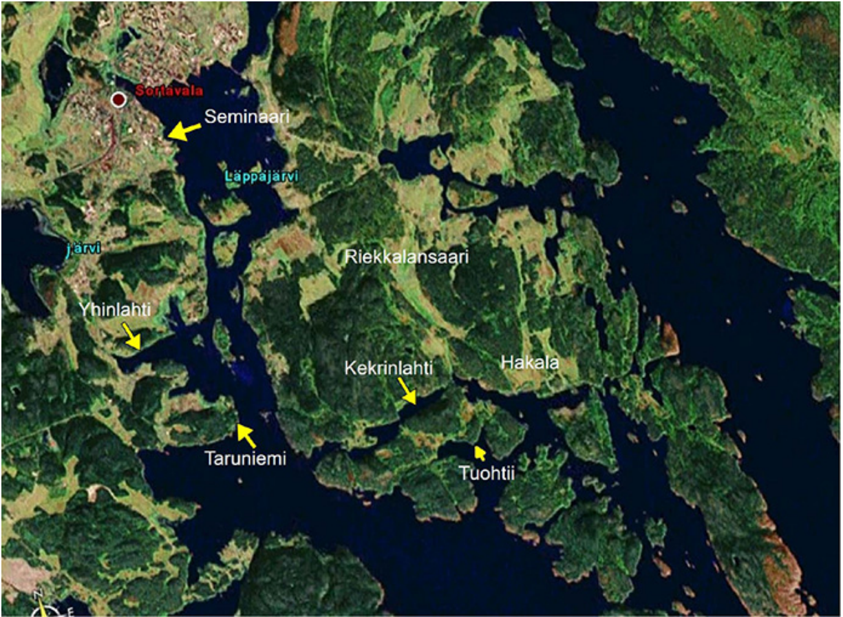
Laivaväylä Sortavalaan ja Riekkalansaari. Sateliittikartta 2010-luvulta.

Muutto maalle keväällä ja takaisin kaupunkiin syksyllä oli iso tapahtuma. Se tapahtui aluksi Sukkela-laivalla, joka vuokrattiin tähän tarkoitukseen. Huvilalle ei ollut tietä, liikenne tapahtui vesitse. Myöhempinä vuosina muuttokuorma kuljetettiin omalla moottoriveneellä ja maallemuuttokin muuttui helpommaksi.