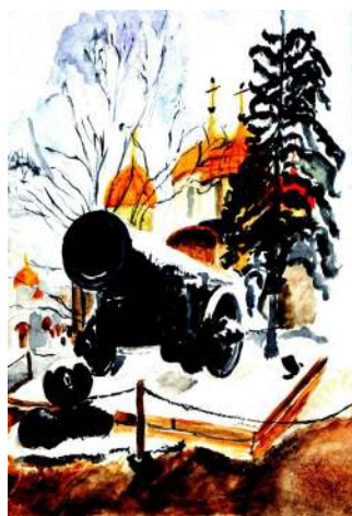
Царь-пушка в Кремле в Москве. Акварель автора.

пустыня, нападение с которой практически неосуществимо. За исключением небольшого участка на границе с Афганистаном, слабое звено, беспокоившее Россию на протяжении веков.