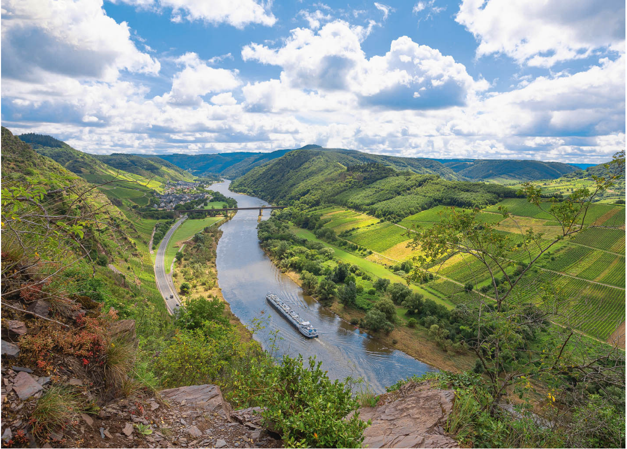
Auf dem Klettersteig Calmont an der Mosel