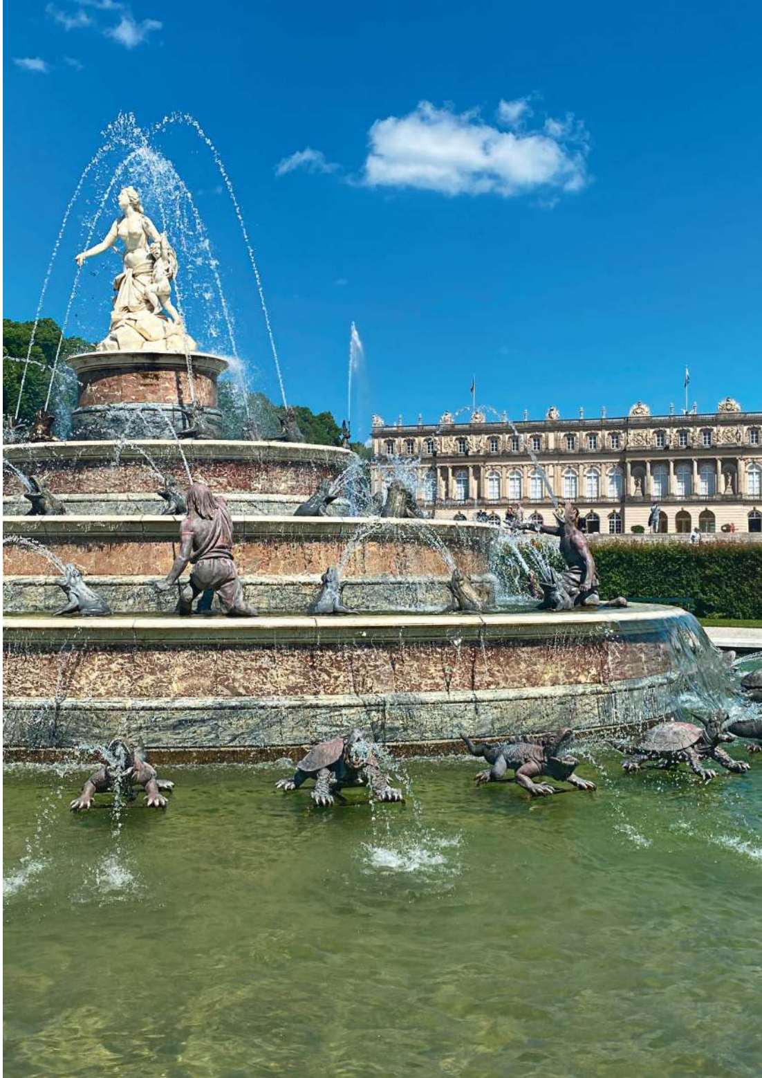
Der malerische Latona-Brunnen vor Schloss Herrenchiemsee