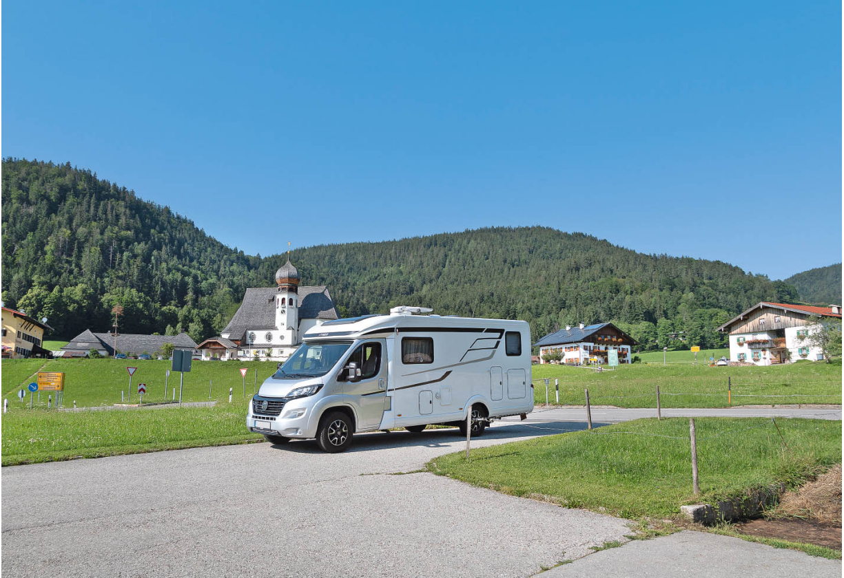
Genuss pur: Mit dem Wohnmobil im Berchtesgadener Land