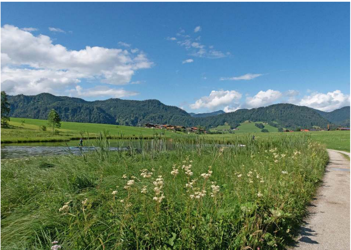
Reit im Winkl - sanfte Bergidylle im Chiemgau