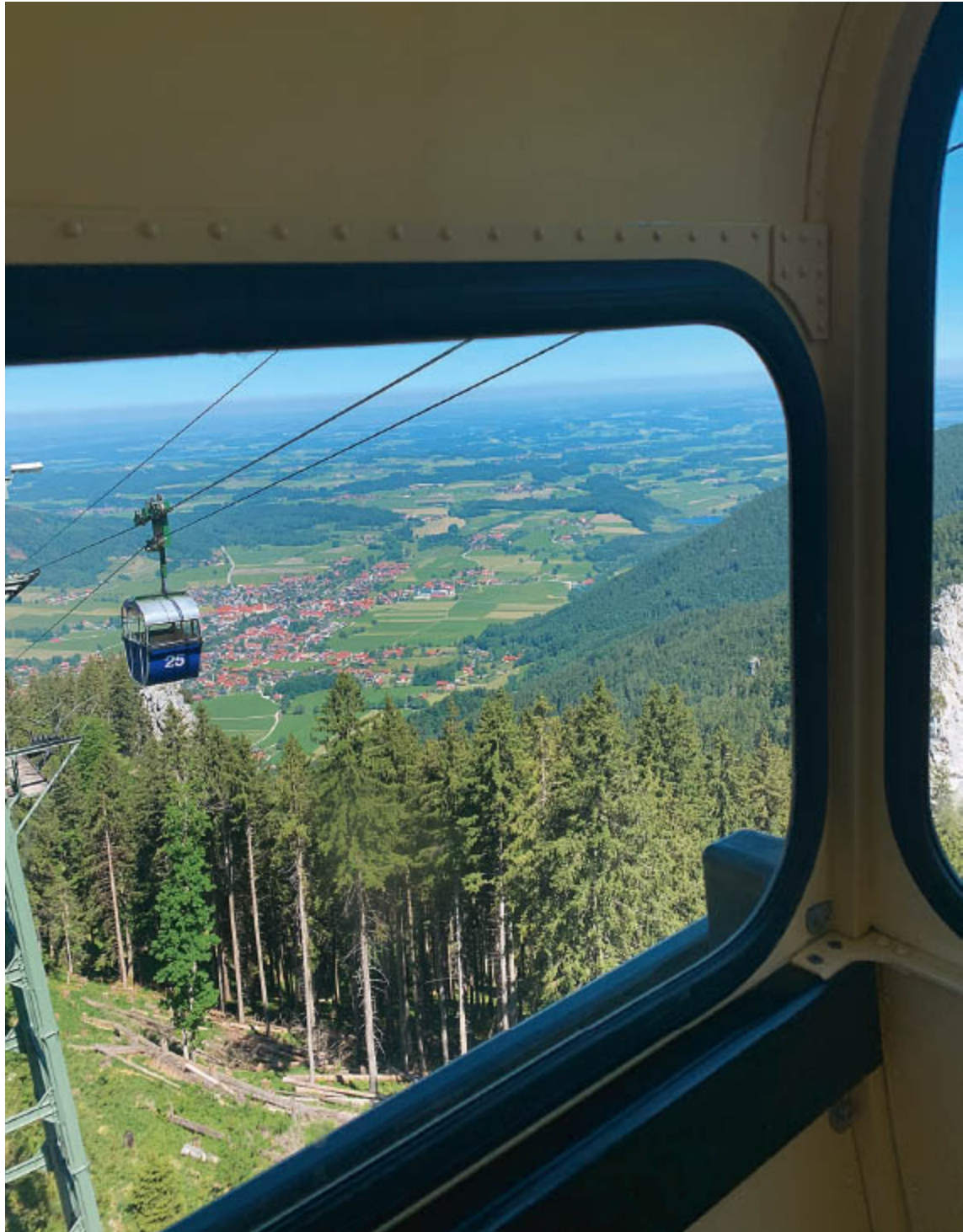
Die nostalgische Kampenwandbahn könnte uns Auf- oder Abstieg abnehmen.