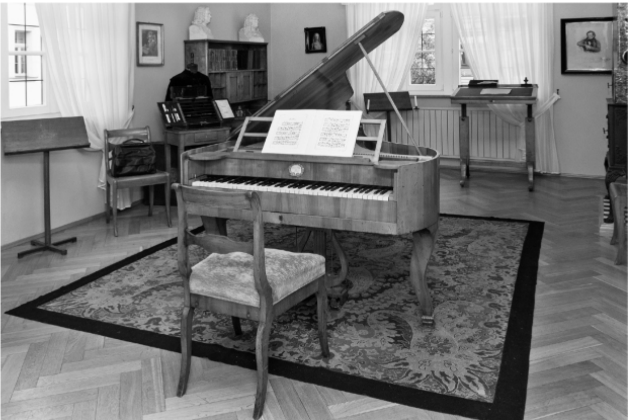
Der Konzertflügel von Andreas Stein, auf dem Clara bei ihrem ersten Auftritt im Gewandhaus spielte. Er steht heute im Schumannhaus Zwickau und ist nach umfangreicher Restaurierung seit 1996 wieder spielbar.

Nicht nur die Aufgaben, die Clara täglich zu absolvieren hatte, richteten sich konsequent nach dem väterlichen Karriereplan und wurden ihr mit erzieherischer Härte zugewiesen. Auch Claras Umgang mit anderen Menschen war streng reglementiert. Nie durfte sie mit anderen Kindern spielen, besuchte insgesamt nur anderthalb Jahre eine öffentliche Schule, |24|erhielt musikalischen Unterricht fast ausschließlich von ihrem Vater und lernte Lesen, Schreiben sowie die für ihre internationale Karriere wichtigen Fremdsprachen Englisch und Französisch bei Hauslehrern.