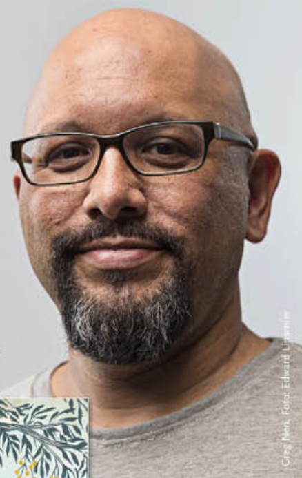
G. Neri