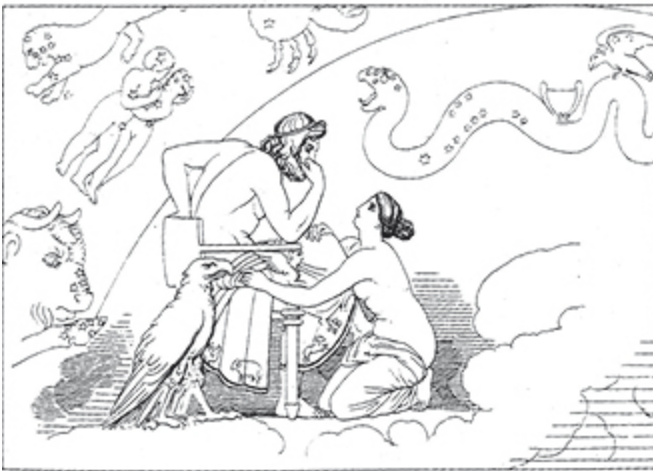
1 John Flaxman: Zeus und Thetis, Umrissstichillustration zu Homers «Ilias», 1793, Hamburg, Kunsthalle, Kupferstichkabinett

Im Verfolg dieser grossen Kunst muss eingestanden werden, dass wir unter grösseren Schwierigkeiten arbeiten als die, die im Zeitalter ihrer Entdeckung geboren wurden und deren Sinn von Kindertagen an an diesen Stil gewöhnt war; sie lernten ihn als Sprache, als ihre Muttersprache. Sie hatten keinen mäßigen Geschmack, um ihn überhaupt wieder verlernen zu können; sie brauchten keinen überzeugenden Diskurs, der sie zu einer günstigen Aufnahme dieses Stils überreden sollte, keine tiefgründigen Nachforschungen nach seinen Prinzipien, um sie von den grossen verborgenen Wahrheiten zu überzeugen, auf denen er gegründet ist. Wir (dagegen) sind gezwungen, in diesen späteren Zeiten zu einer Art Grammatik und Wörterbuch Zuflucht zu nehmen, als dem einzigen Weg, eine tote Sprache wiederzuerlangen.