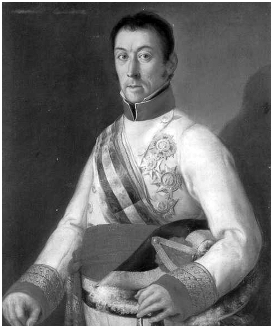
Figura 1. Miguel Parra. Retrato del General Elío. 1815. ol/li. 92 x 70 cm. Museo de Bellas Artes de Valencia.

Elío había de tener un protagonismo importante hasta su forzado regreso a la Península a comienzos de 1812. 1