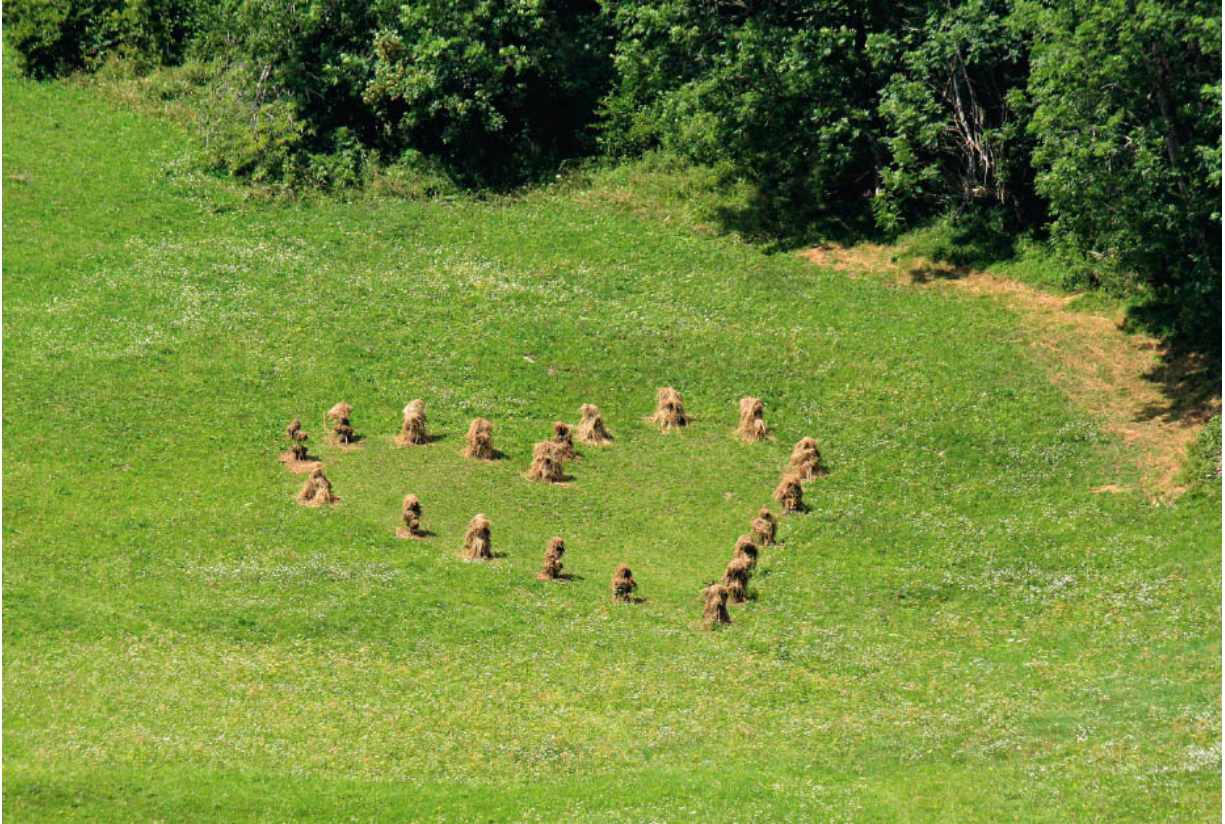
Ein Herz für Wohnmobilisten am Wegesrand