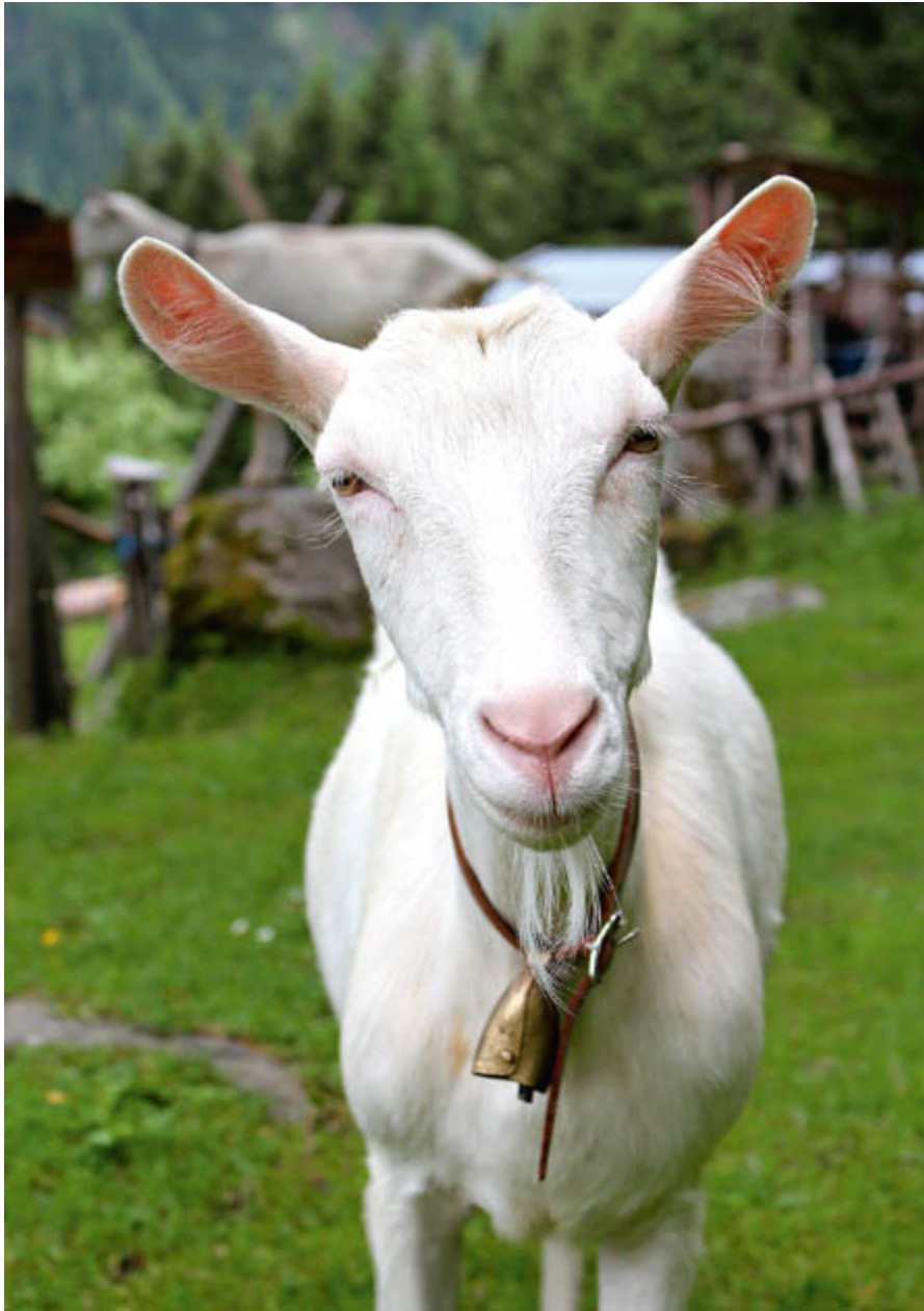
Neugieriger Besuch am Gasthof Friedburg

Utensilien - Regenjacke, ausreichend Getränke, Obst oder andere Snacks, Erste-Hilfe-Paket und (bei einer nicht ausgeschilderten Strecke) eine Karte oder ein GPS-Gerät zur Orientierung, denn nicht immer ist ein störungsfreier Empfang des Smartphones gewährleistet - sollte deshalb unbedingt dabei sein.