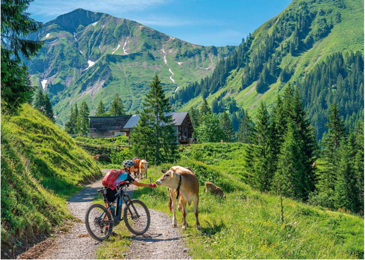
»Treffen« im Bregenzer Wald