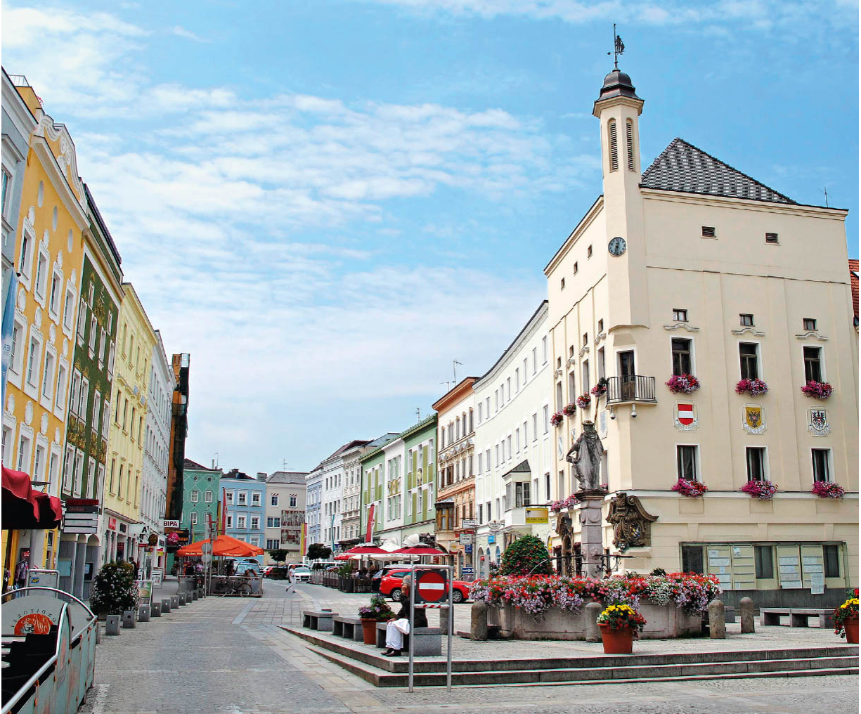
Blick auf den Hauptplatz von Ried im Innkreis