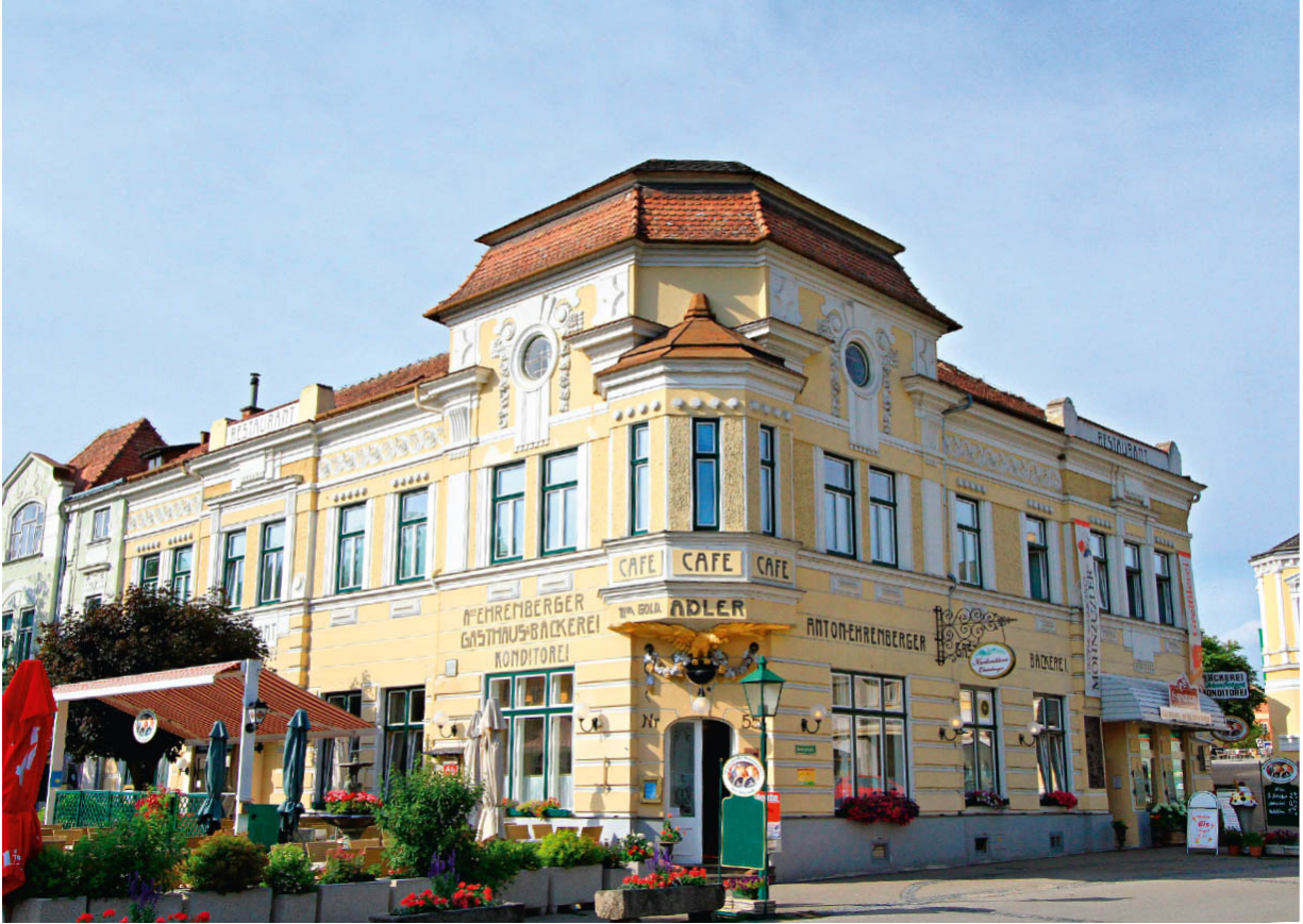
Kaffeehaustradition in Gars am Kamp