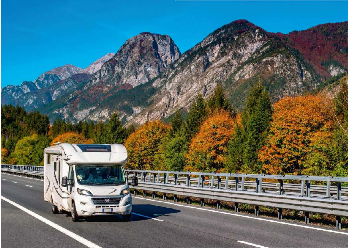
Auf der Fahrt durch Tirol