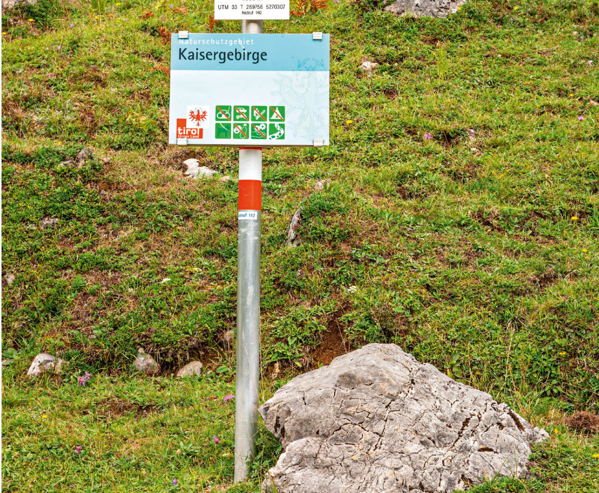
Alle Richtungen sind interessant.