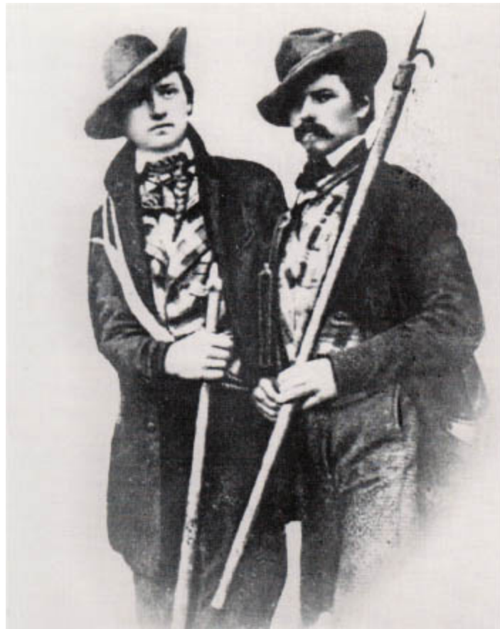
Die Brüder Adolph und Hermann Schlagintweit in den Alpen um 1850

Gletscher haben die Wissenschaft auch früher schon fasziniert. Mit die ersten Forscher, die sie gezeichnet und vermessen haben, waren die Gebrüder Schlagintweit. Sie kartierten Mitte des 19. Jahrhunderts auch die Pasterze am Großglockner (»Der Pasterzengletscher«, 1847–1852, Aquarell über Bleistift von Hermann oder Adolph Schlagintweit).