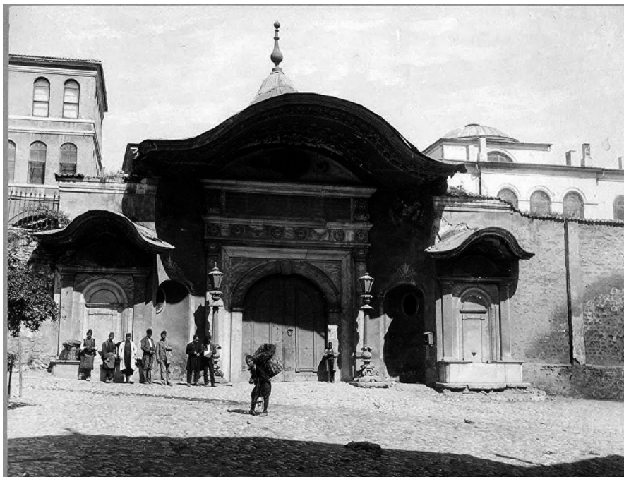
Abb. 1: Die »Hohe Pforte« ( Bab-ı ali ), der Eingang zum Amtssitz des Großwesirs in Konstantinopel, zur Zeit Mahmud II.

europäischen Mächte geboten erschienen. Insofern ist die Geschichte des Osmanischen Reichs zwischen 1774 und 1918 mehr als nur ein Abgesang. Sie lässt vielmehr erkennen, ein wie hohes Maß an Selbstbehauptungswillen sowie an Kraft zu Erneuerung und Veränderung in Staat und Gesellschaft noch steckten.