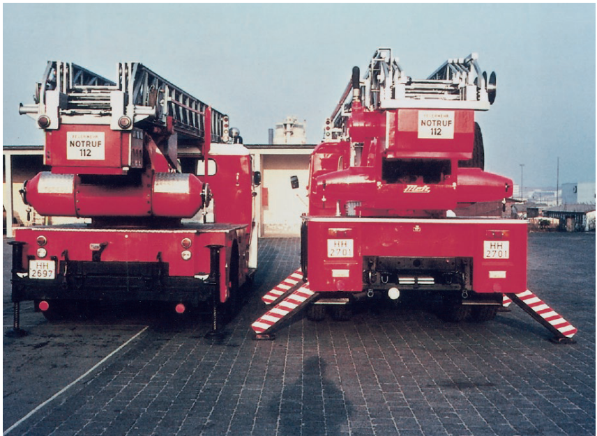
Bild 2: Die hydraulische Schrägabstützung (rechts) ermöglichte eine größere seitliche Ausladung des Leitersatzes als die senkrechte Spindelabstützung

Als wesentliche Weiterentwicklung im Drehleiterbau kann die Einführung der Rettungskörbe angesehen werden. 1965 stattete Magirus seine Drehleitern mit einem an der Leiterspitze einzuhängenden Korb aus, mit dem die Rettung gehunfähiger Personen aus oberen Geschossen ermöglicht werden sollte. Auch wenn Metz bereits in den 1930er-Jahren mit Körben, die zum Teil unter der Leiterspitze an Drahtseilen hängend befestigt waren, experimentierte, legte sich der Karlsruher Drehleiter-Hersteller erst 1967 auf das System eines auf der Leiterspitze stehenden zwangsgesteuerten Rettungskorbes fest.