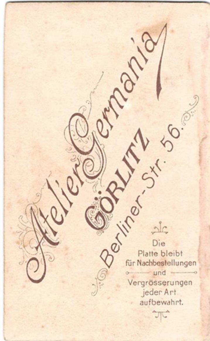
Vor- und Rückseite einer Fotofotografie aus dem Atelier Germania. Nach 1902.

Atelier Kaiser Friedrich (siehe Rudolf Günther)