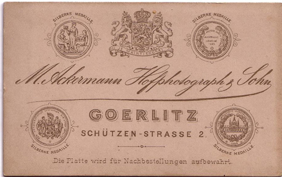
Eine Fotografie aus dem Atelier von Julius Ackermann. 90er Jahre des 19. Jhd.