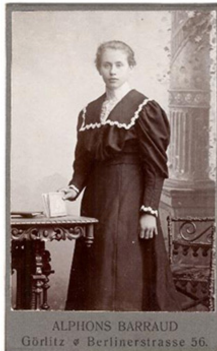
Eine Fotografie aus dem Atelier von Alfons Barraud. Um 1905.

Ein ziemlich unbekannter Fotograf, der um 1904 die Räume des Hinterhauses an der Berlinerstraße Nr. 56 übernahm. Das Atelier befand sich im Parterre und ersten Stock. Barraud blieb unter dieser Adresse bis ca. 1908.