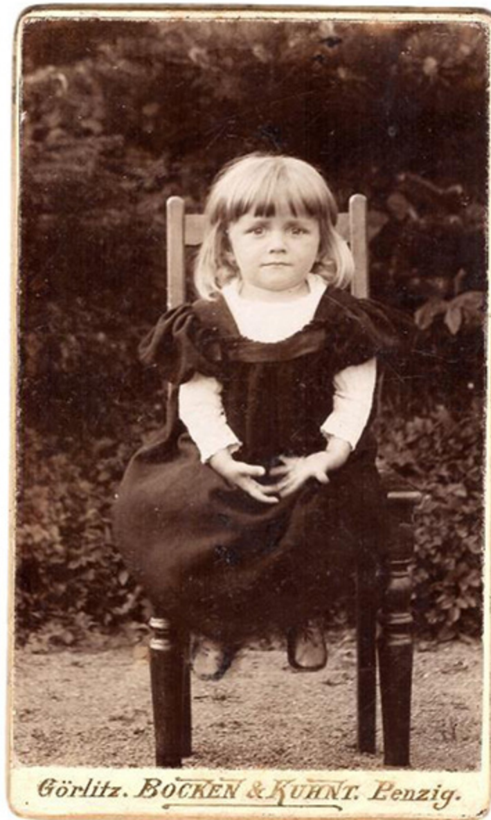
Eine Fotografie aus dem Atelier von Bocken & Kuhnt. Anfang des 20. Jhd.

Ein fotografisches Geschäft, das Anfang des 20. Jahrhunderts in Görlitz und Penzig bestand.