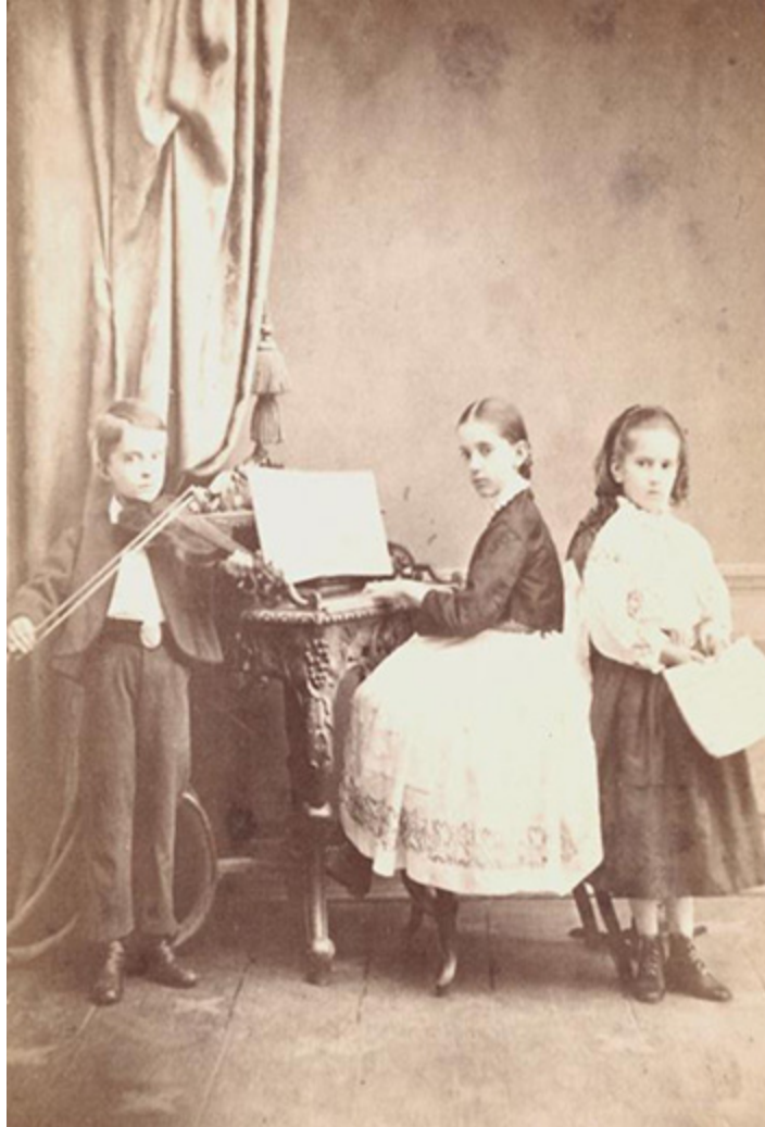
Zwei Fotografien aus dem fotografischen Atelier von Moritz Ackermann. 60er Jahre des 19. Jhd.