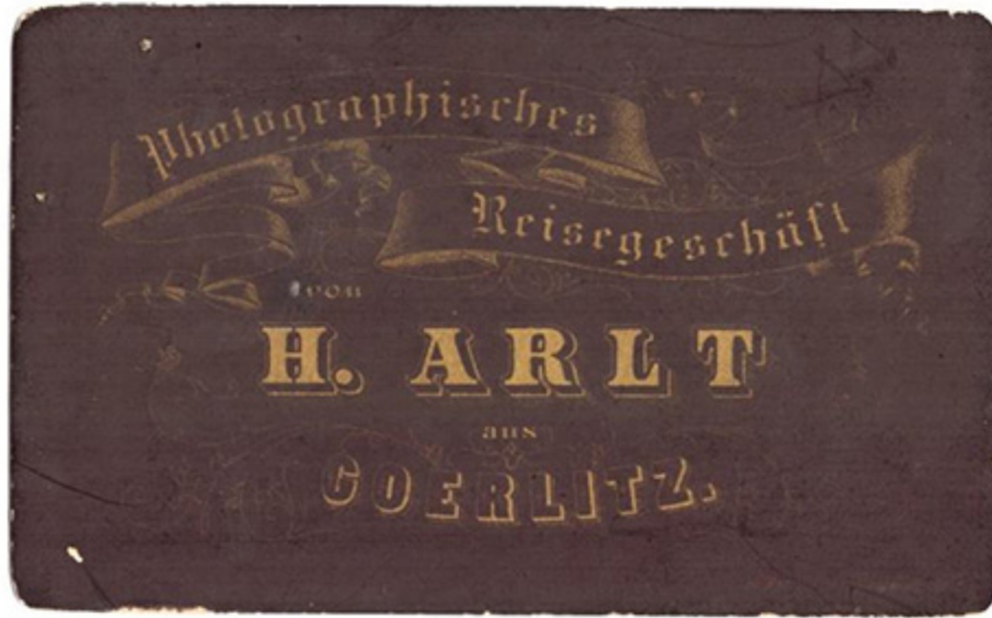
Vor- und Rückseite einer Fotografie aus dem fotografischen Atelier von Heinrich Artl. 70er Jahre des 19. Jhd.