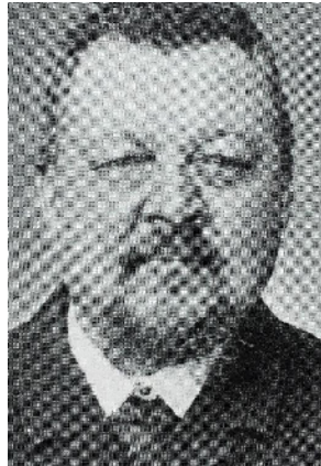
Der Bürgermeister: Jacob Wintermantel.

Das Markrecht erhält St. Georgen im Jahr 1507 durch Kaiser Maximilian I. und im Jahr 1891 das Stadtrecht. Im Jahr 1891 hieß der damalige Bürgermeister Wintermantel.