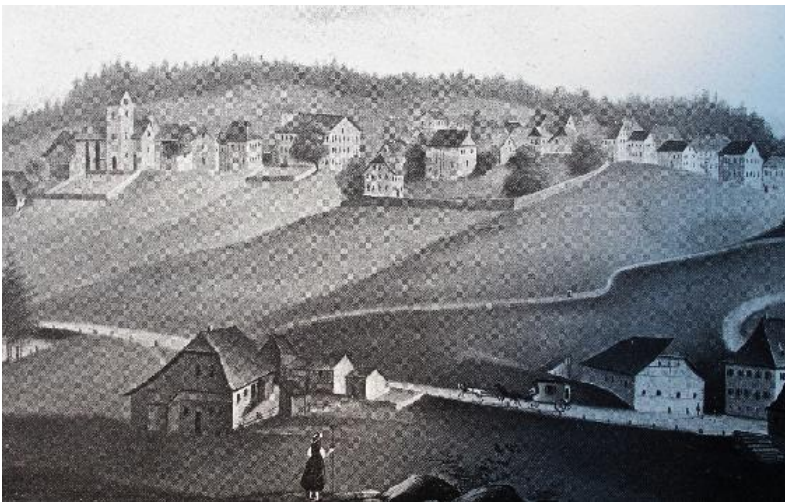
Die neue Poststraße.

Im Jahr 1839 war sie dann fertig und die Badische Landstraße Nr. 29 wurde am 1. Juli eröffnet. Für St. Georgen bedeutete die Postroute den Beginn einer langanhaltenden wirtschaftlichen Blüte.