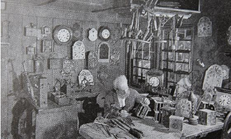
Eine typische Schwarzwälder Uhrmacherwerkstatt.