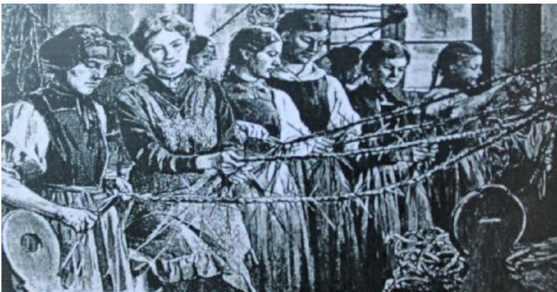
Frauen und Mädchen beim Strohflechten.