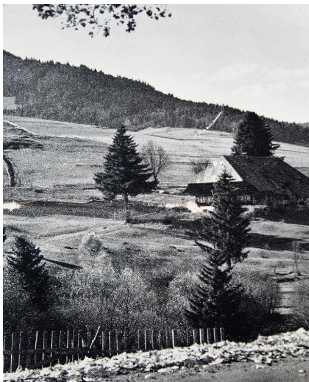
Eine alte Postkarte mit dem Titel: Das Laub fällt! Höhenzüge bei Bernau.

Sorry, ich musste meine Klischees einfach mal loswerden! Ich fange deshalb, mal geschichtlich betrachtet, von vorne an.