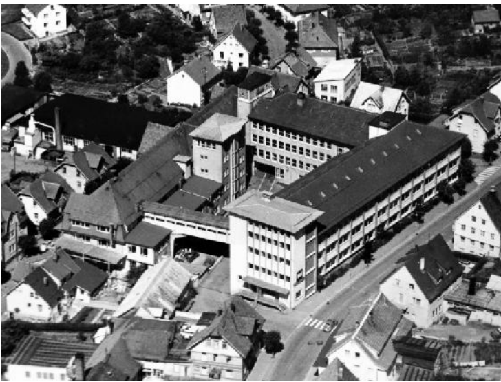
Das „Gesicht“ von Dual. Das Stammwerk in St. Georgen.