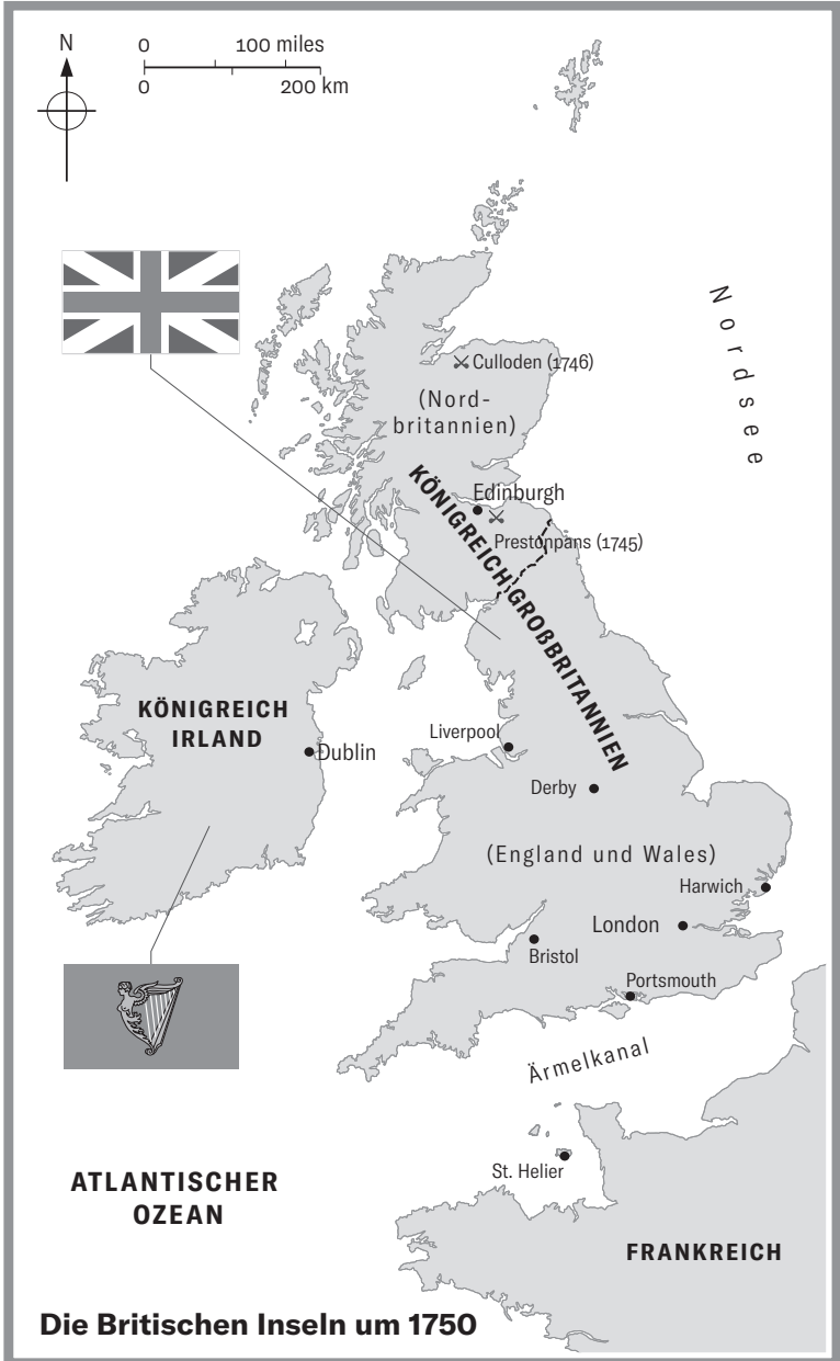
Die Britischen Inseln um 1750