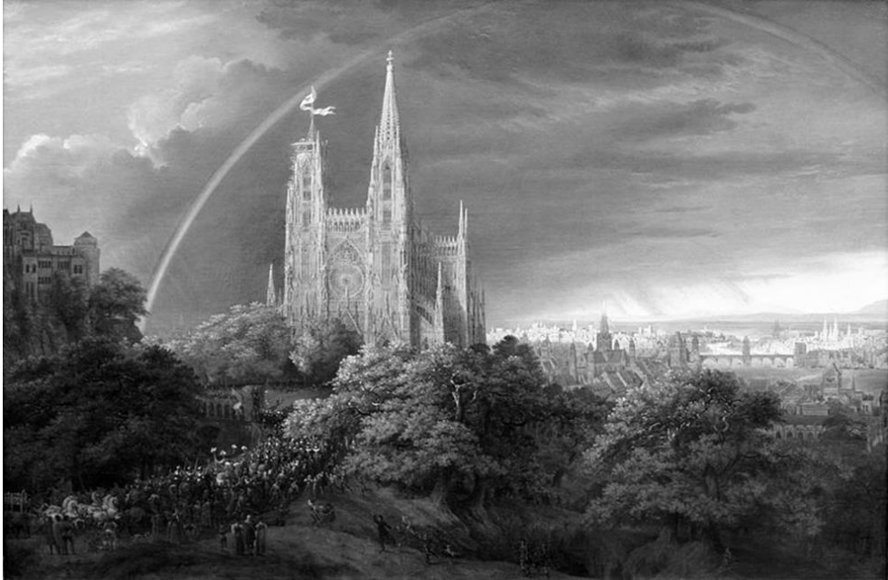
Abb. 3: Mittelalterliche Stadt an einem Fluss (K.-F. Schinkel, 1815) Berlin – National- galerie

Was als romantische, nationale Bewegung begann, wurde spätestens ab 1871 zum nationalistischen Pathos. Das preußische Kaisertum stellte sich in die Tradition der großen Kaiser des Mittelalters. Mittelalterliche Kunst und Architektur instrumentalisierte man als Sinnbilder deutscher Tradition und Größe. Burgen und Pfalzen werden rekonstruiert und mittelalterliche Dome nach Jahrhunderten des Baustillstands fertiggestellt.