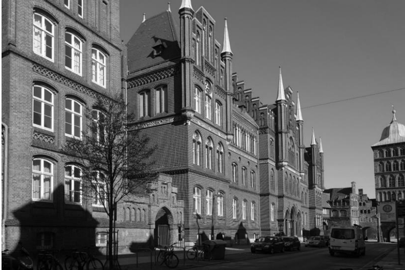
Abb. 1: Amtsgericht (A. Schwaning, 1893-96)