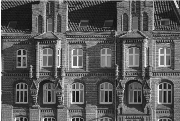
Abb. 5: An der Untertrave 55 – Hauptzollamt (1875-76)