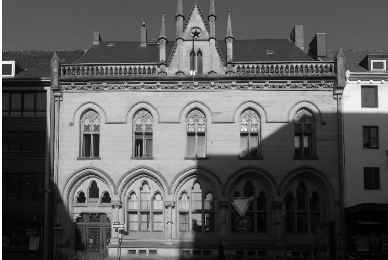
Abb. 4: Königstraße 42 – Ehem. Reichsbank (M. Hasak, 1894-95)