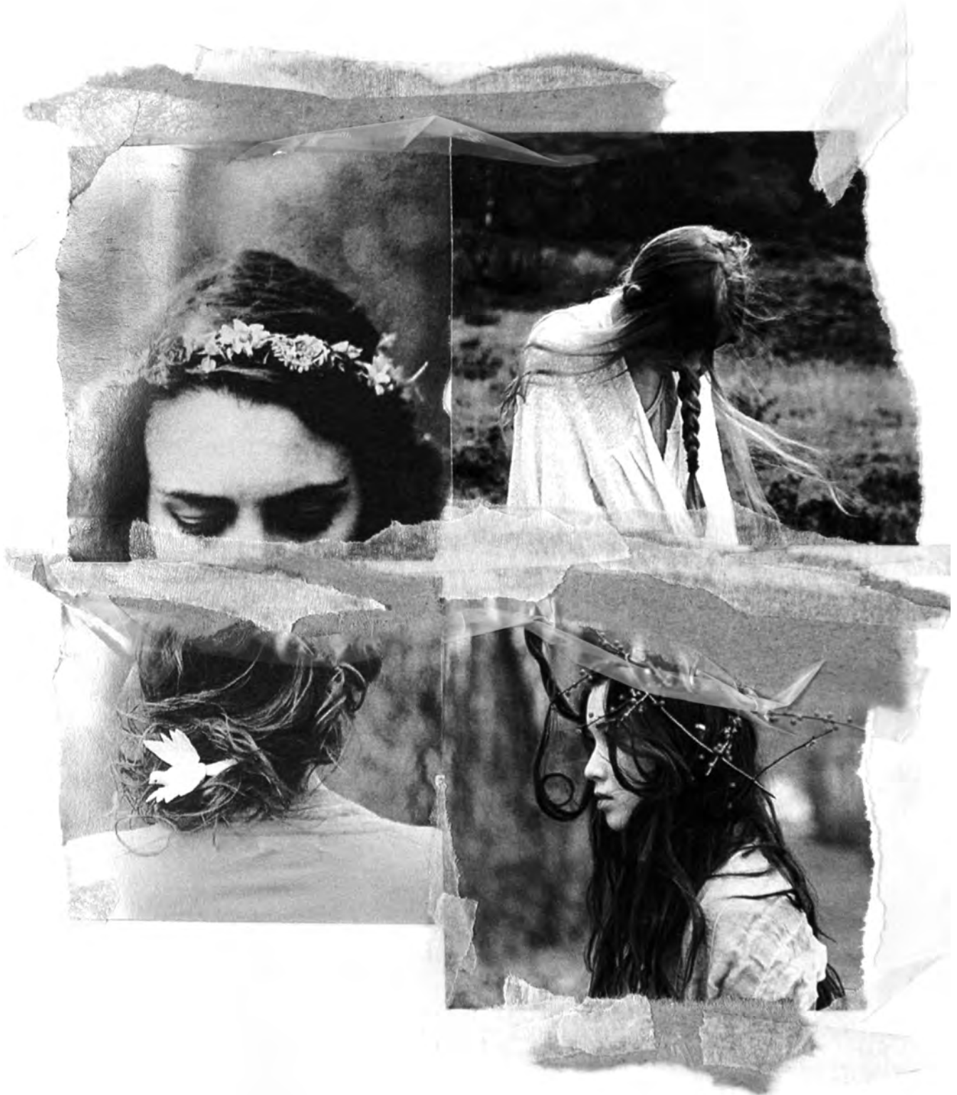
Diario visual. Proyecto Friga y Freya. Semestre 2012-10.