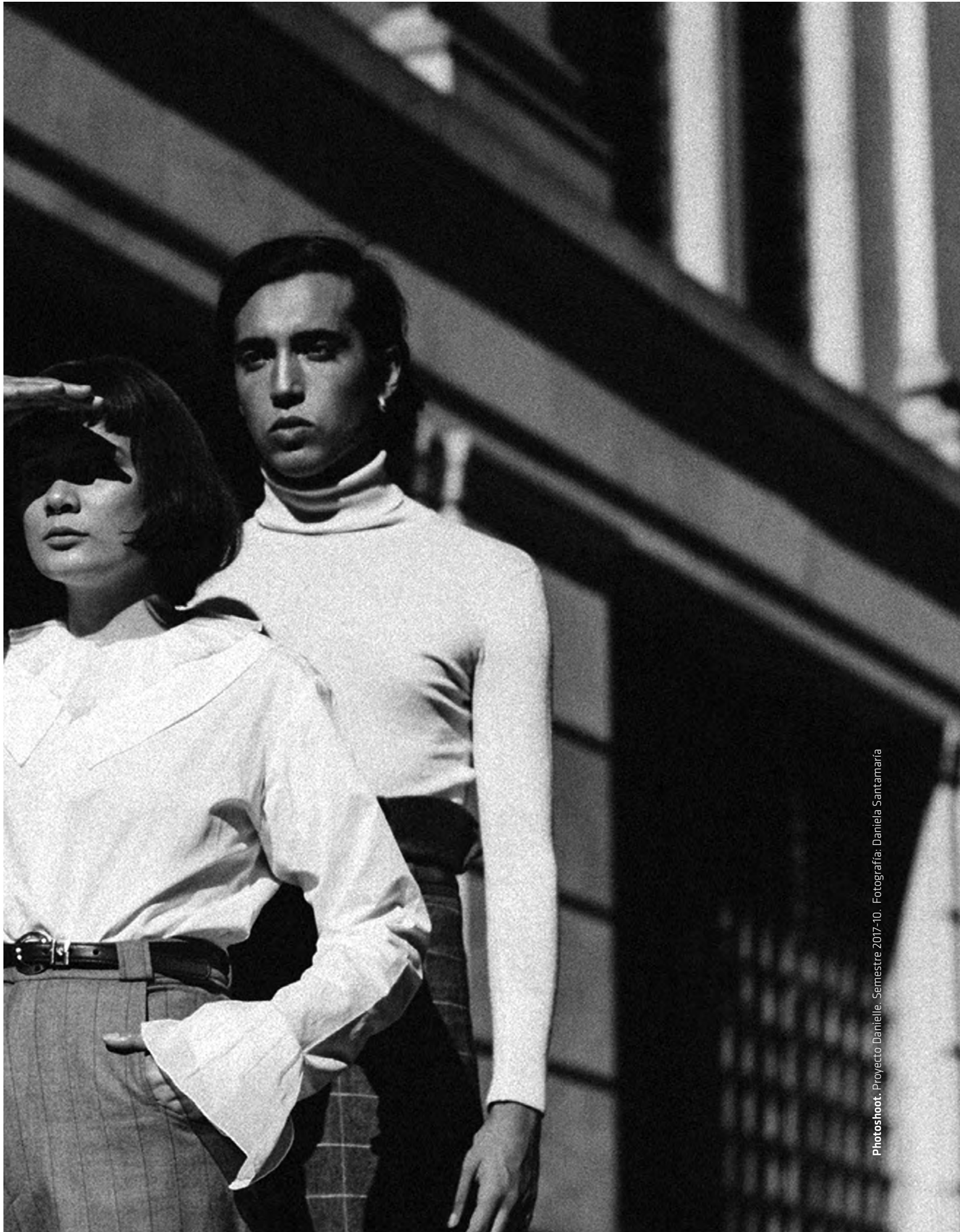
Photoshoot. Proyecto Danielle. Semestre 2017-10.