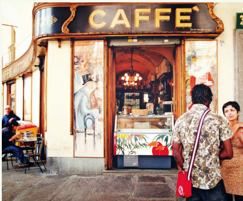
Ohne Kaffee geht in Turin gar nichts und nirgendwo lässt er sich prächtiger trinken als hier

Gut zu wissen: Nach Turin kann man fliegen oder per Bahn anreisen. Wer mit dem Wagen kommt, zahlt normalerweise hohe Parkgebühren. Also besser die öffentlichen Verkehrsmittel nutzen und die Torino+Piemonte Card organisieren, mit der man in der gesamten Region freie Fahrt mit Bus und Bahn, kostenlosen Eintritt in den meisten Museen und zahlreiche Rabatte erhält. Reisezeit ist eigentlich das ganze Jahr, auch Wintersport ist möglich. Der Lago Maggiore und der Lago d'Orta dagegen kennen nur eine sehr kurze Sommersaison. Weinliebhaber reisen im Spätsommer/Herbst in die Langhe, Trüffelsüchtige im Spätherbst/Winter nach Alba.