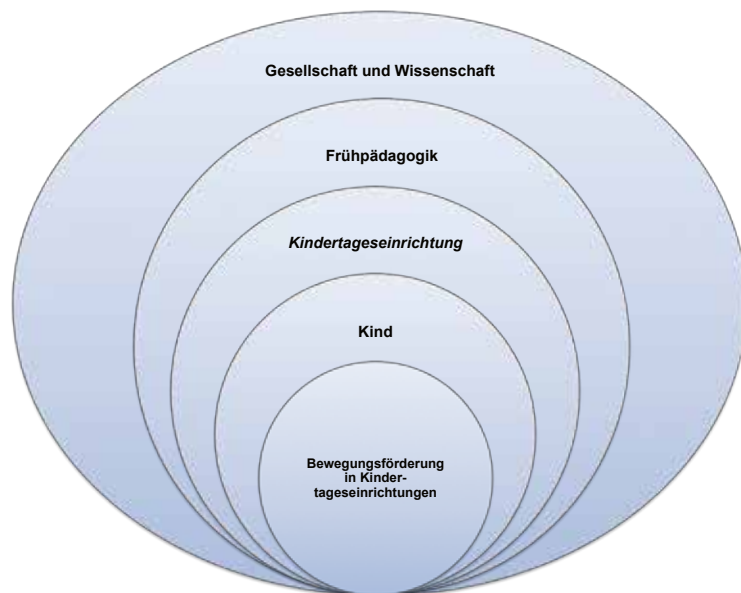
Abb. 1: Gesamtkontext früher Bewegungsförderung in Kindertageseinrichtungen

Abb. 1 visualisiert den Gesamtkontext vergleichbar mit der Zoomfunktion einer Kamera: Von einer höheren Ebene (Gesellschaft und Wissenschaft) wird immer weiter in die Bewegungsförderung einer konkreten Kindertageseinrichtung hineingezoomt.