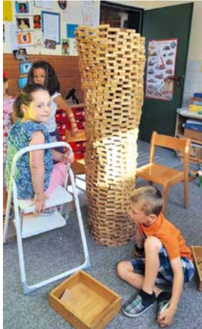
Abb. 3: Spiel mit Fröbelmaterial

Auch Fröbels Idee der Erziehungspartnerschaft von Vorschuleinrichtungen mit den Eltern hat bis heute Bestand. Darüber hinaus initiierte er einen ersten Rahmenplan zur Ausbildung von pädagogischen Fachkräften. Aufgabe der Fachkraft sei es demnach, das Spiel zu leiten, zu beobachten und zu dokumentieren.