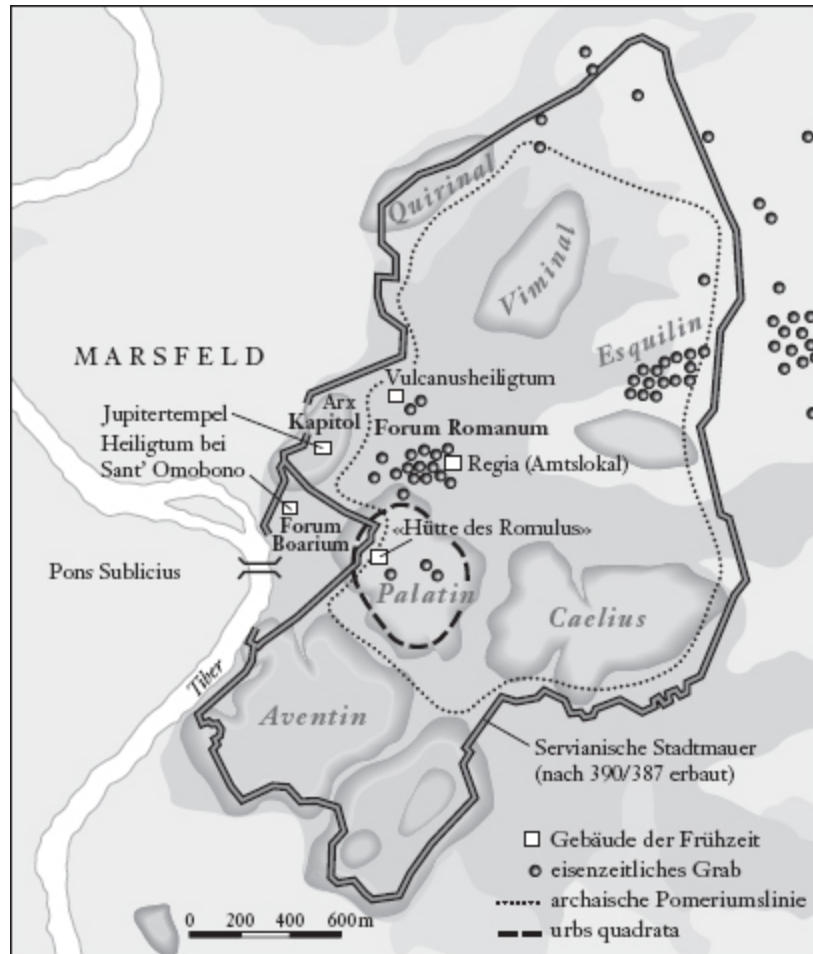
Abb. 1: Das archaische Rom

Überdies konnte das pomerium , diese oft als scharf verstandene Grenze zwischen dem Drinnen und Draußen, zwischen Frieden und Krieg, in einigen bezeichnenden Fällen von Feldherren überschritten werden. Dies galt zum einen für den Notfall der unmittelbaren kriegerischen Bedrohung der Stadt Rom, in dem der dictator seinen Oberbefehl, dem ausnahmslos jeder Römer unterworfen war, auch innerhalb des pomerium ausüben konnte. Zum anderen traf dies auch auf den Fall einer Massenmobilmachung aller wehrfähigen Bürger zu, des sogenannten tumultus . Dies drückte sich auch im Wechsel der Kleidung aus: jeder Römer war dann aufgefordert, seine Toga mit dem Soldatenmantel ( sagum ) zu