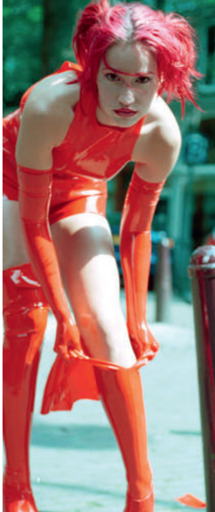
006 BIANCA BEAUCHAMP