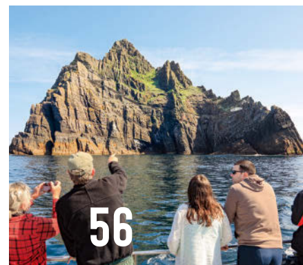
Einsamer geht es nicht vor Irlands Küste: Skellig Michael