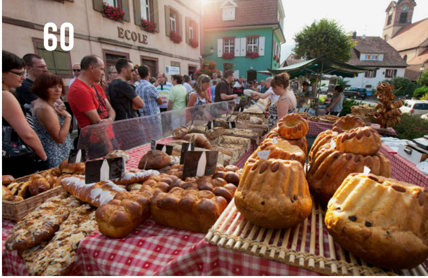
Kulinarisches Paradies: Wochenmarkt in Obernai