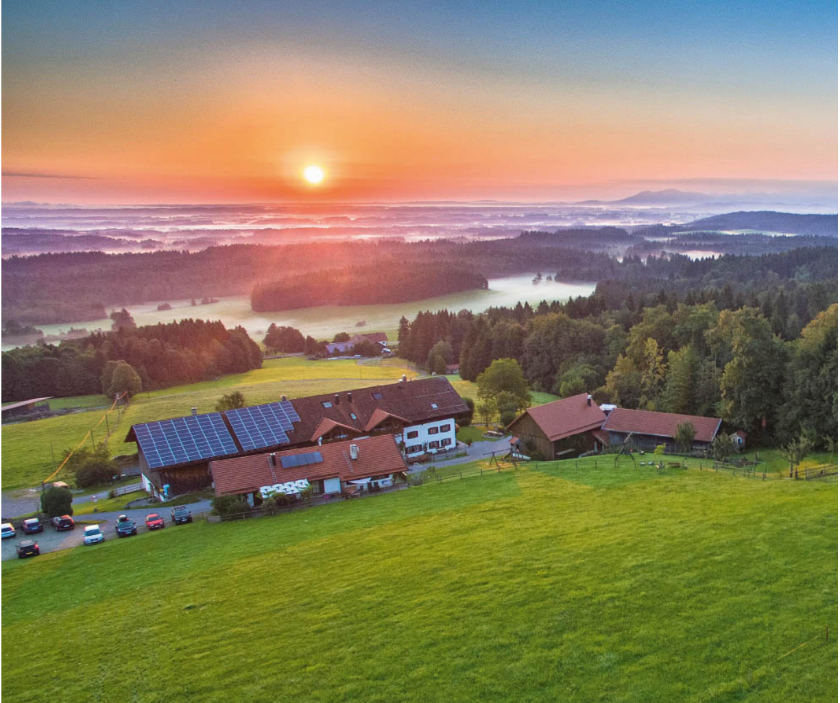
Herrliche Lage im oberbayerischen Pfaffenwinkel.