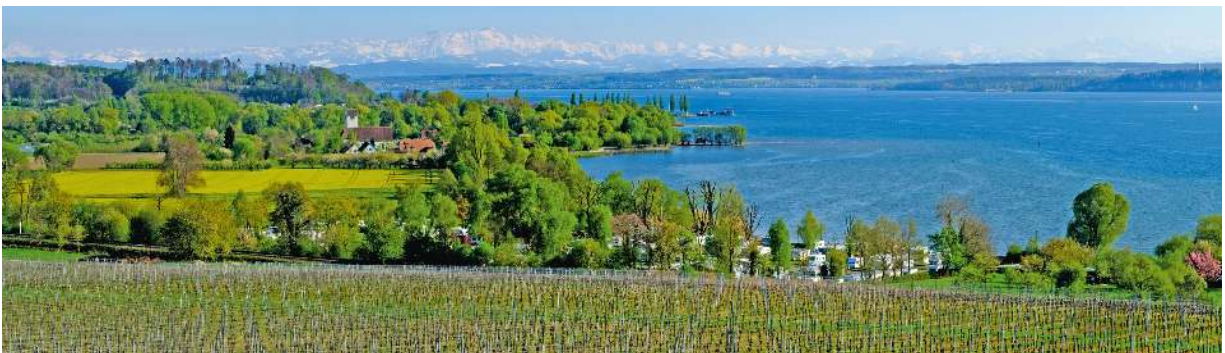
Herrliche Aussicht auf den Bodensee von der Wallfahrtskirche Birnau