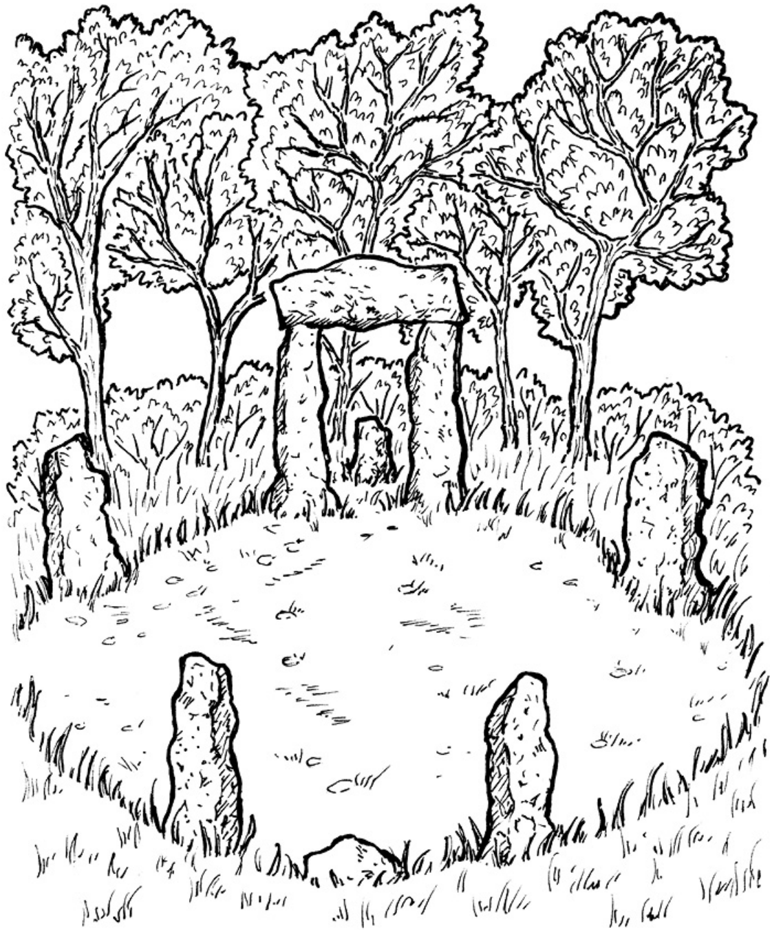
Роша и круг

Описать священные места и практики можно самыми разными словами! И это многое говорит о большинстве обществ и культур, ведь мы, как правило, хотим провести четкую границу между сакральным и