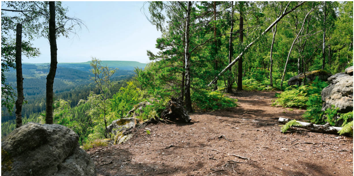
Fast immer wandert man mit Aussicht, TOUR 22 .