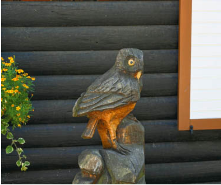
Geschnitzte Eule an einer Einkehrmöglichkeit, TOUR 15