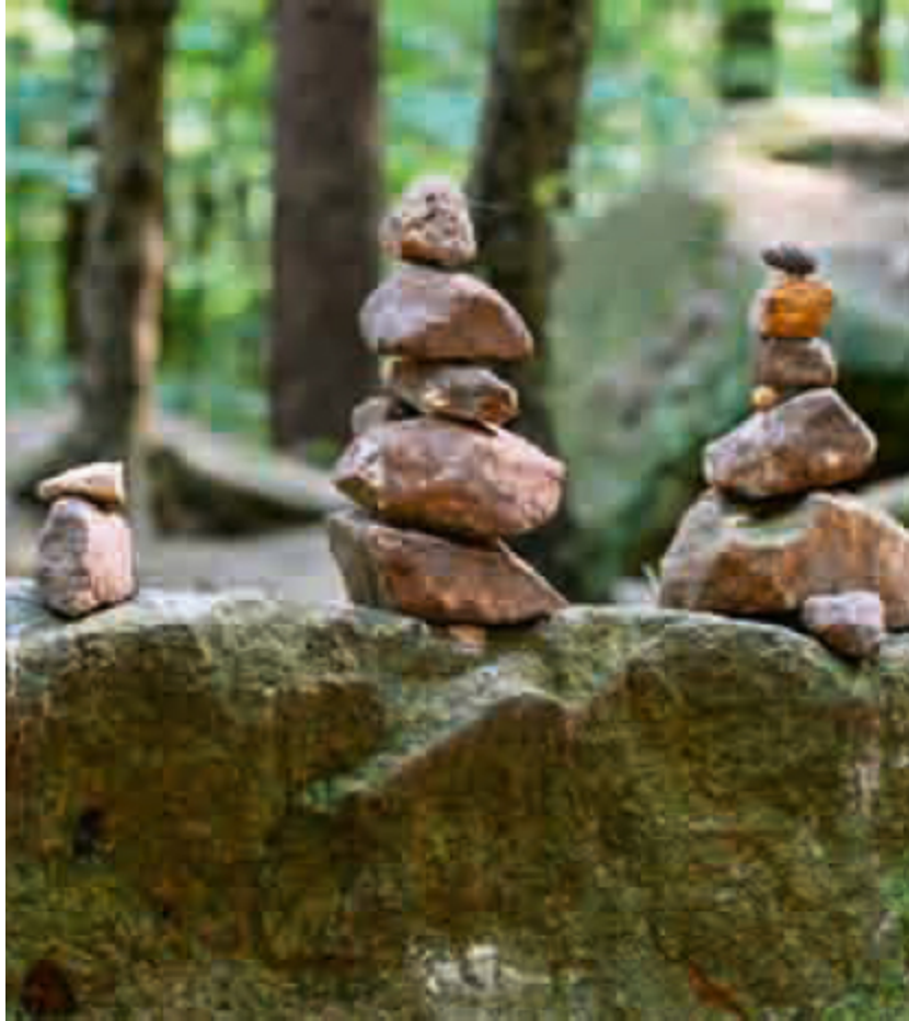
Steinhäufchen am Wegesrand, TOUR 13